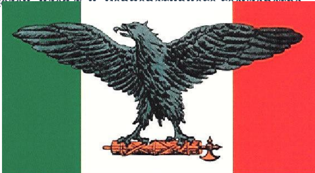
Флаг Италии во времена фашистской диктатуры

Термин «Фашизм» имеет двойное происхождение. С итальянского fascio переводится как «лига». С латинского – «пучок». Он выступал как символ древнеримской администрации. Лидер итальянского фашизма – премьер-министр страны – сделал фасции отличительным знаком своей партии. Начиная свою деятельность, он стремился к восстановлению Римской империи. Фасция была принята в 1919 г. Считается, что с этого момента зародился фашизм — политическая идеология диктаторского типа, представляющая государство как высшую ценность, а народ (нацию) — объединённой корпорацией людей, чья цель — корпоративное государство.