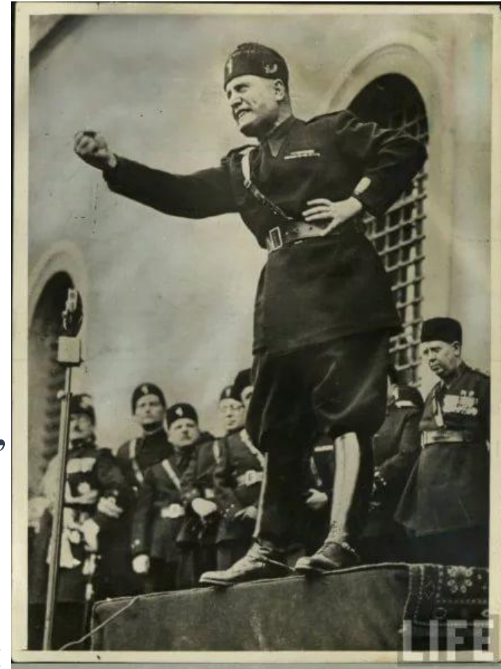
Муссолини на выступлении перед народом