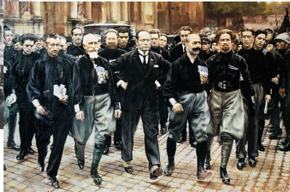
Муссолини в марше похода на Рим