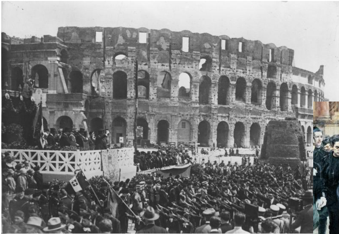
Оборона Рима октябрь 1922г