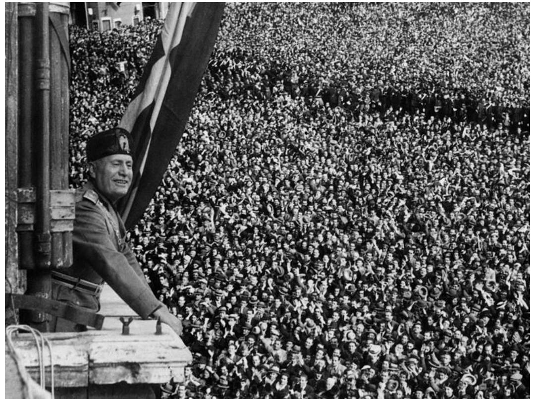
Муссолини перед народом

«Фашистский эксперимент» Муссолини оказал огромное влияние на весь мир. Именно как состоявшаяся концептуальная, идеологическая, политическая, экономическая, социальная