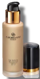
Антивозрастная тональная основа Коды 32047 - 32051