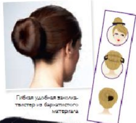
Гибкая удобная заколка-тавастер из бархатистого материала

Многофункциональная заколка. Для волос быстро и без особых усилий создай классический или другой тип узла на каждый день. Материал: помпестер. Размер: 31 x 5 см.