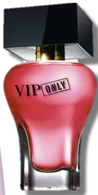
Парфюмерная вода Код 31998