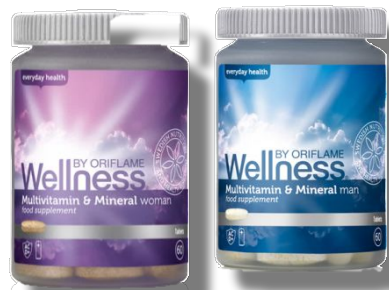
«Мультивитамины и минералы» для женщин Код 22794