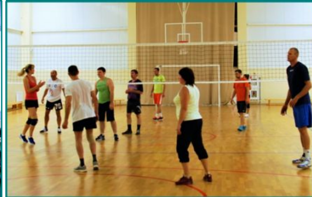
Аэробный и спортивный залы

Важно иметь при себе спортивную обувь и одежду для занятия спортом.