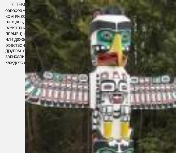
ТОТЕМ — комплекс верований и обрядов первобытных народов, связанный с представлениями о родстве между группами людей (семей, родов, племен) и каким-то животным, рептилией — растением или даже предметом. Тотем считался родственником (отцом, старшим братом) или другом, от которого магическим образом зависели жизнь и благосостояние рода в целом и каждого его члена в отдельности.