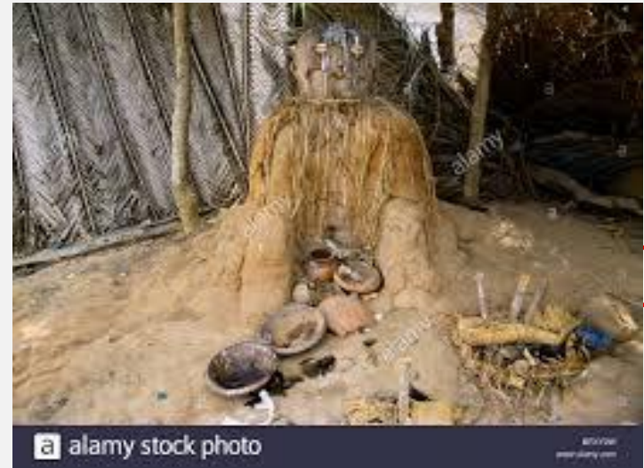
животного, искусно сделанная фигурка, ювелирное изделие.

ТОТЕМИЗМ (от слова «ототеман», на языке североамериканских индейцев — род его) — комплекс верований и обрядов первобытных народов, связанный с представлениями о родстве между группами людей (семей, родов, племен) и каким-то животным, рептилией — растением или даже предметом. Тотем считался родственником (отцом, старшим братом) или другом, от которого магическим образом зависели жизнь и благосостояние рода в целом и каждого его члена в отдельности.