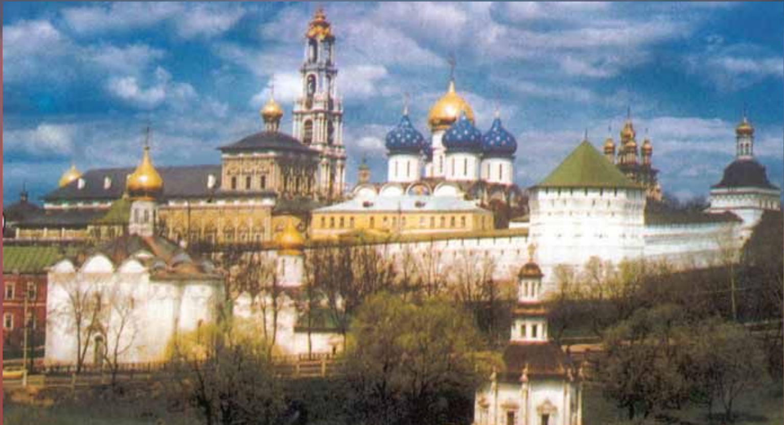
Троице-Сергиев монастырь. Загорск

общежительный монастырь, особо значительный по своим размерам, по количеству храмов и подвижающихся в нем монахов