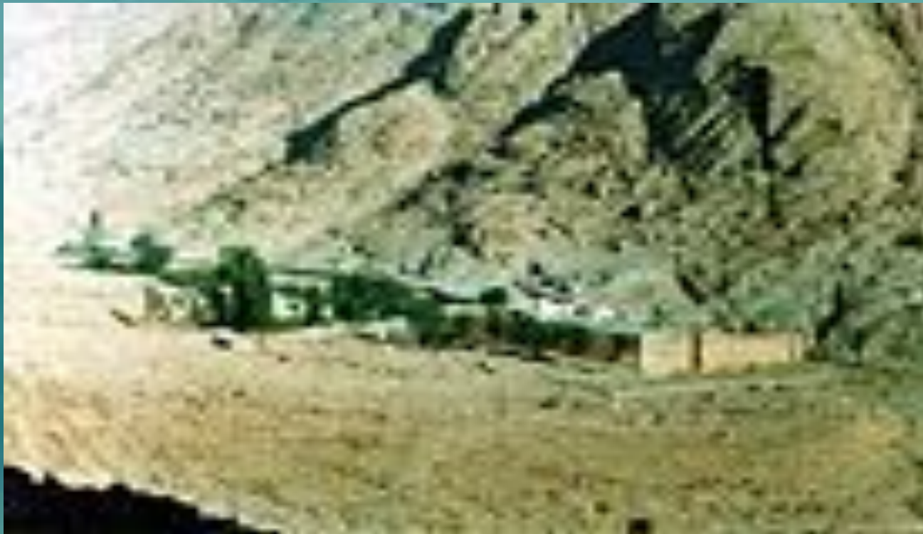
Монастырь Святой Екатерины около горы Синай

По большей части скиты устраиваются неподалеку от больших монастырей