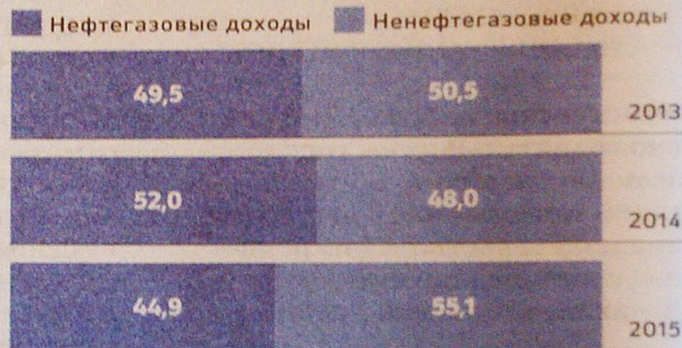
Соотношение нефтегазовых и нефтегазовых доходов за I полугодие 2013–2015 годов, %