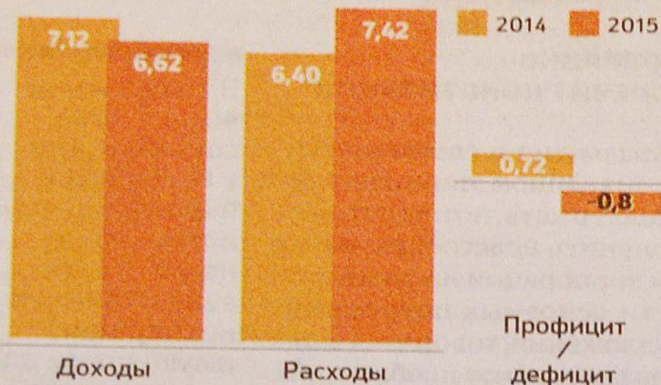
Доходы и расходы бюджета в I полугодии 2014 и 2015 года, трлн руб.