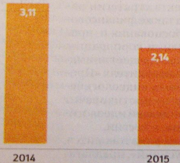
Неналоговые доходы бюджета в I полугодии 2014 и 2015 года, трлн руб.