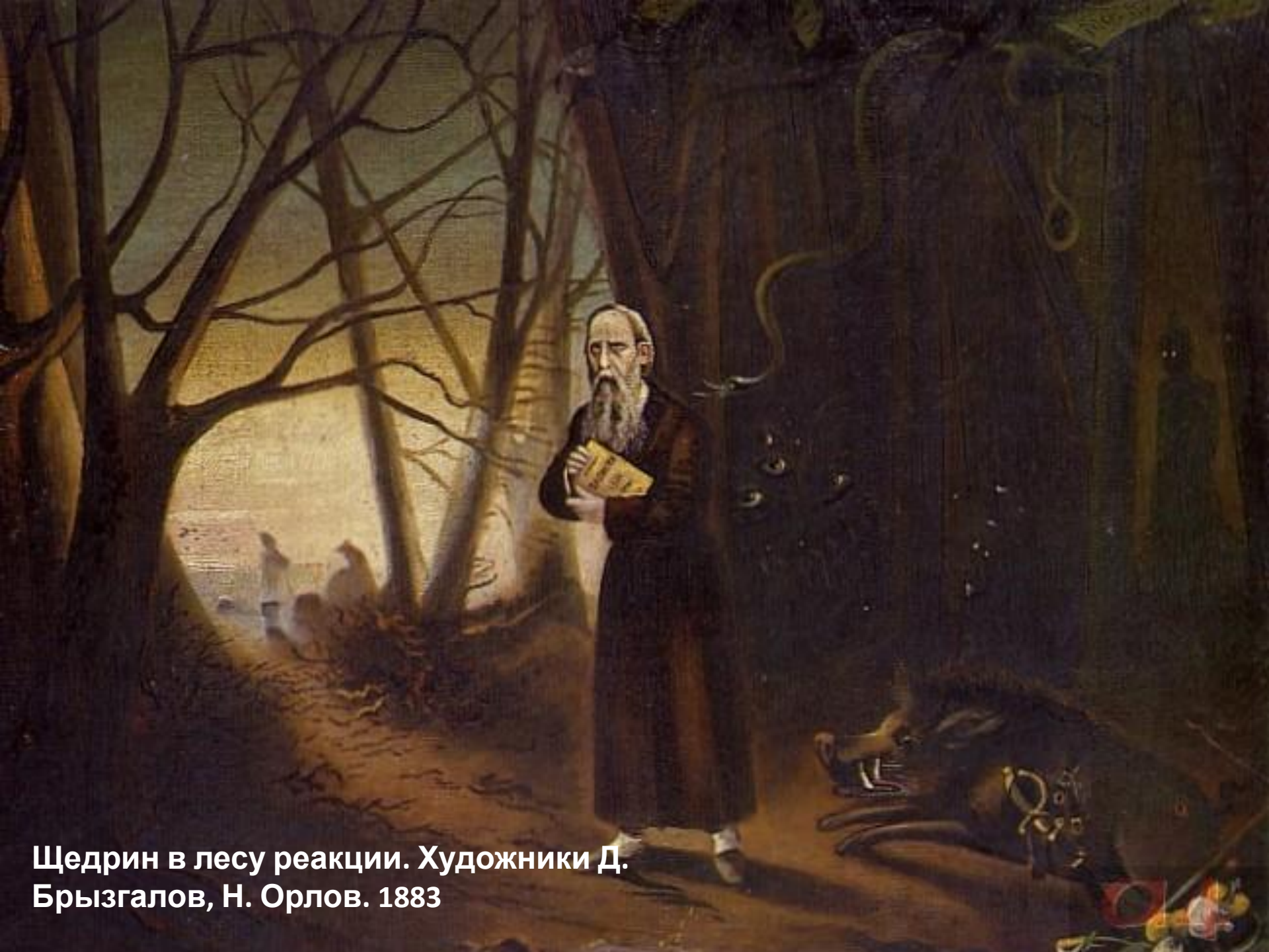
Щедрин в лесу реакции. Художники Д. Брызгалов, Н. Орлов. 1883