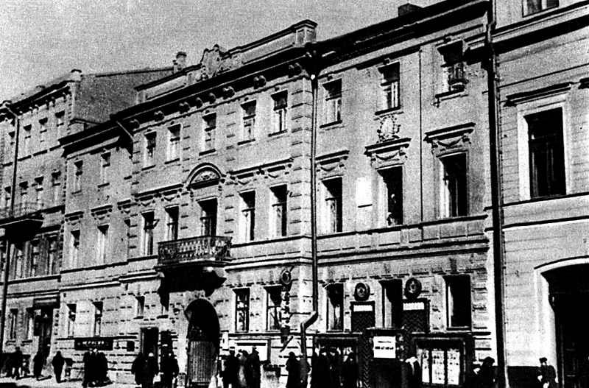
Дом в Петербурге, где жил М.Е.Салтыков