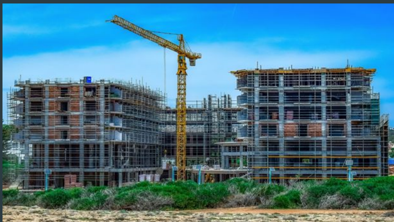
Стройки (или ремонтные зоны)