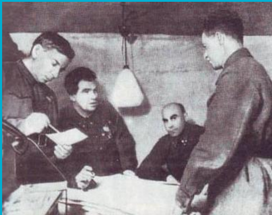
В штабе 62-й армии: Н.И.Крылов, В. И.Чуйков, К.А.Гуров, А.И.Родимцев

17 июля 1942 года передовые части фашистской группы армий «Б» в большой излучине Дона встретились с войсками Сталинградского фронта. Началась Сталинградская битва.