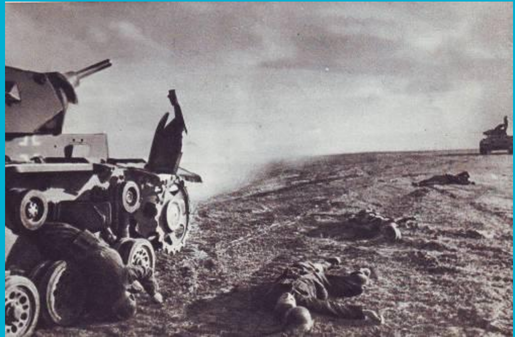
Атака немецких танков отбита

28 июля 1942 года Народный комиссар обороны СССР издал приказ № 227, вошедший в историю под названием «Ни шагу назад!»