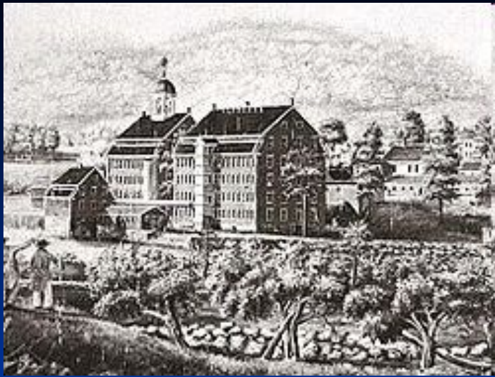
Текстильная фабрика в Бостоне, созданная в 1813 г.