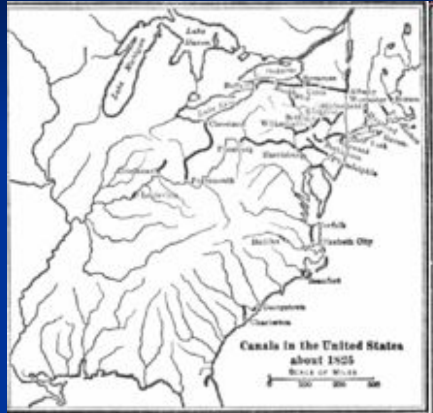
Каналы в США к 1825 г.

Аналогично было создано множество компаний для строительства каналов. К 1812 г. их было построено только три, в Виргинии, Южной Каролине и Массачусетсе. В 1817 г. был построен канал Эри, соединивший реку Гудзон с Великими озерами. В 1825 г. законодательное собрание штата Пенсильвания приняло решение о строительстве сети каналов, соединяющих Филадельфию с западными регионами и Великими озерами. До 1848 г. сеть каналов соединяла штаты от Массачусетса до Иллинойса. Многие каналы были финансово успешными, но некоторые едва не довели штаты Огайо, Пенсильвания и Индиана до банкротства.