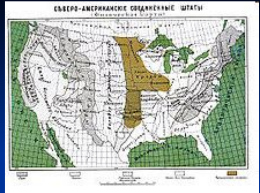
Конец XIX века