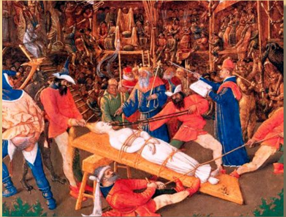
Сцена из «Мистерии о св. Аполлонии» (фрагмент). Миниатора Ж. Фуке

Наибольшей популярностью пользовались мистерии, посвященные Страстям Господним.