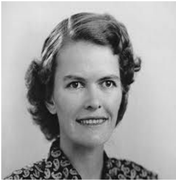
Джулия Робинсон (1919-1985)

Исследовала вопрос о том, является ли диофантовым множество, состоящее из троек :