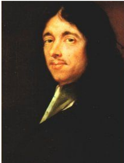
Пьер Ферма (1601 - 1665)