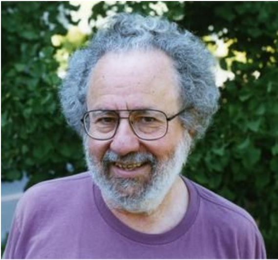
Мартин Дэвис род. 1928 г.

М. Дэвис перешёл от формулировки Десятой проблемы Гильберта в целых числах к естественной для теории алгоритмов формулировке в натуральных числах .