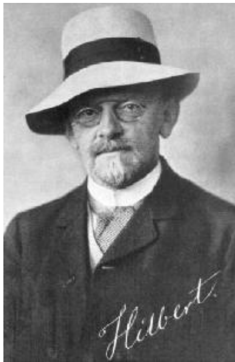
Давид Гильберт (1862 - 1943)

8 августа 1900 года на заседании 5-й и 6-й секций II Международного конгресса математики со своим докладом выступил знаменитый немецкий математик, профессор Геттингенского университета Давид Гильберт .