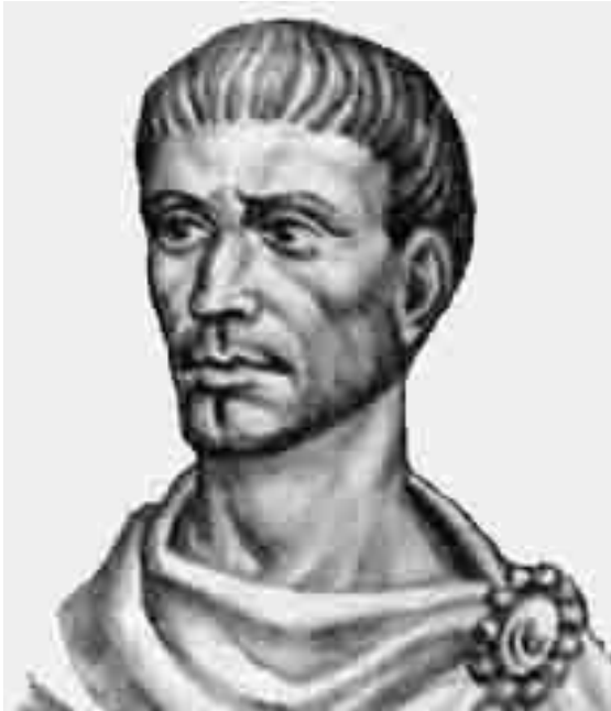
Диофант Александрийский 3 в. н.э.

В этой книге произошел окончательный отказ от так называемой "геометрической алгебры" и переход к новому математическому языку, так называемой "буквенной алгебре".