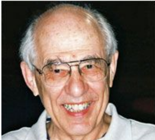
Хилари Патнем род. 1926г.

В 1958 году М. Дэвис и Х. Патнем публикуют работу в которой они рассмотрели класс экспоненциально-диофантовых уравнений, имеющих вид: