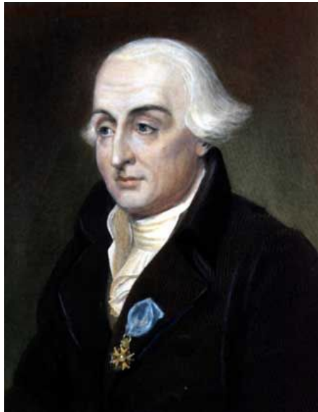
Жосеф Луи Лагранж (1736 - 1813)