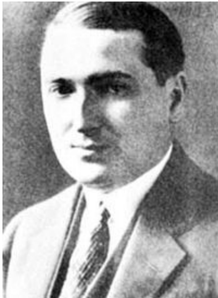
Эмиль Пост (1897-1954)

И уже в 1944 году Э. Пост пишет в одной из своих работ: