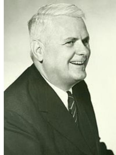
Алонзо Чёрч (1903-1995)