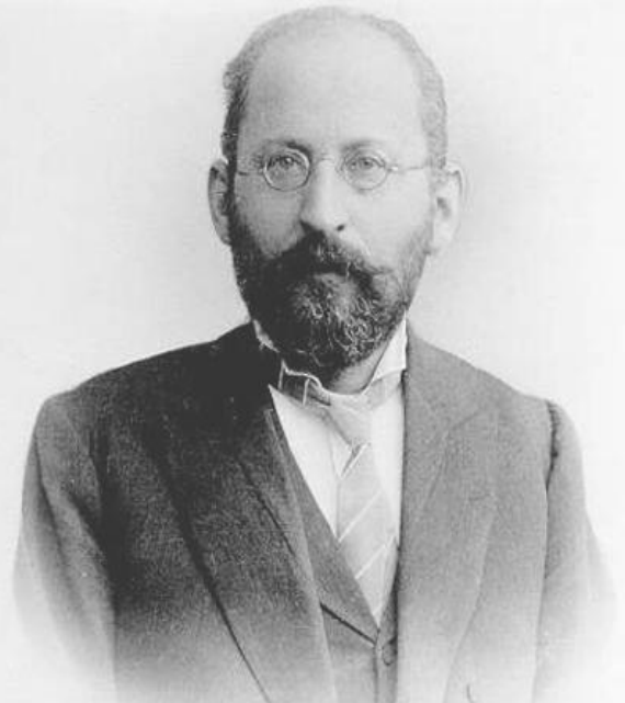
Sosialismin edellytykset ja sosialidemokratian tehtävät