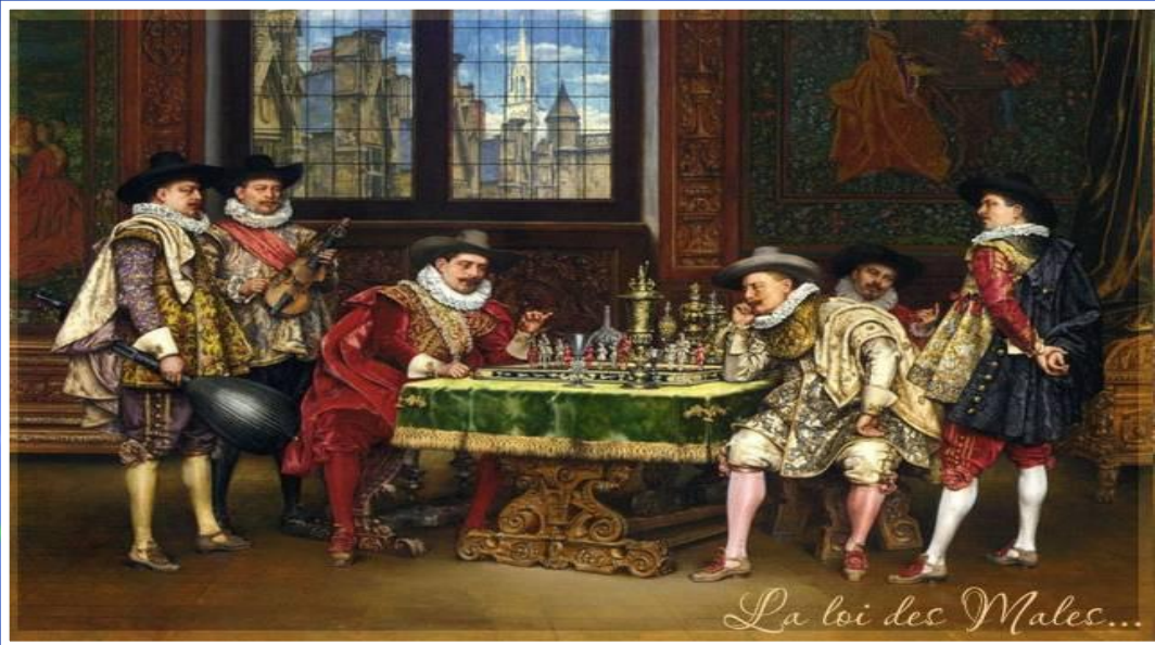
Дворяне за игрой в шахматы. Конец XVI в.

Дух предпринимательства захватил дворянство. С конца XV века начинается процесс огораживания – насильственный сгон крестьян с земли дворянами и превращение этих наделов в пастбища для овец