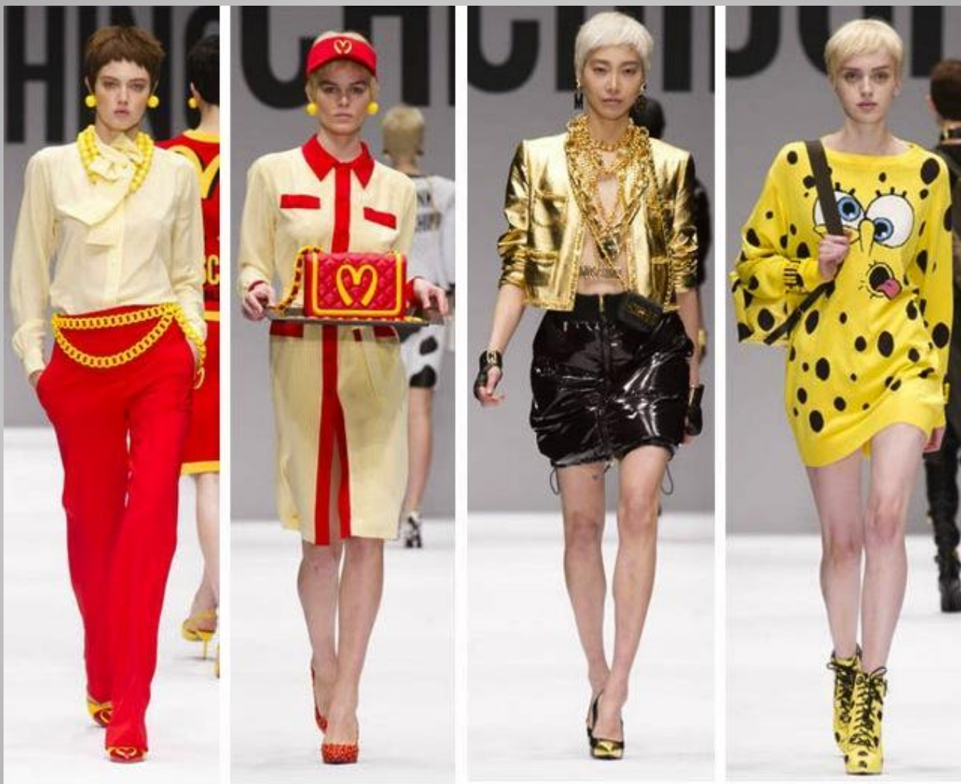
Коллекция Джереми Скотта, 2014 год. Moschino