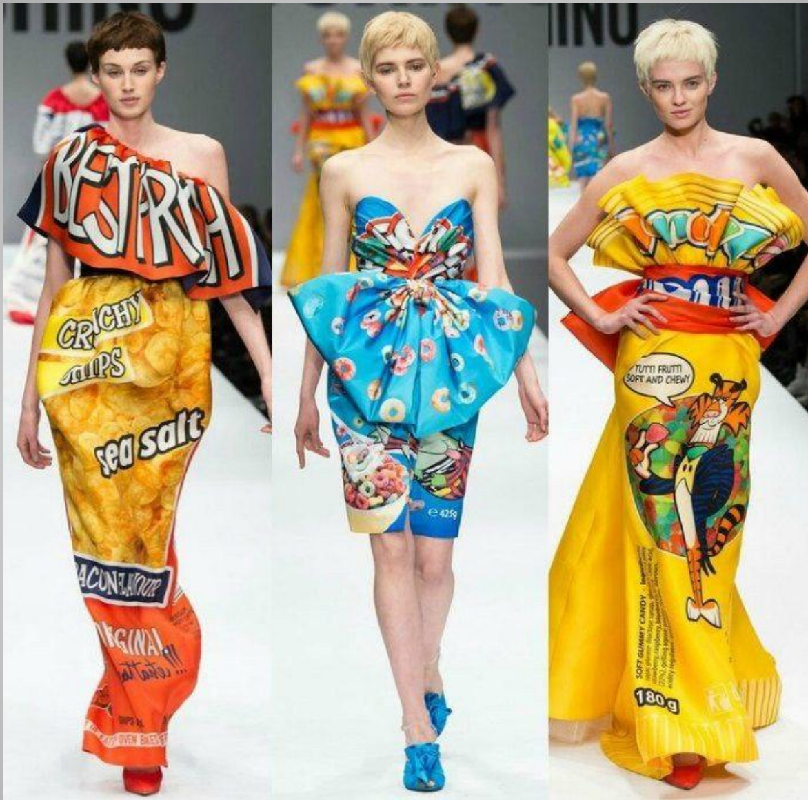
Коллекция Джереми Скотта, 2014 год. Moschino