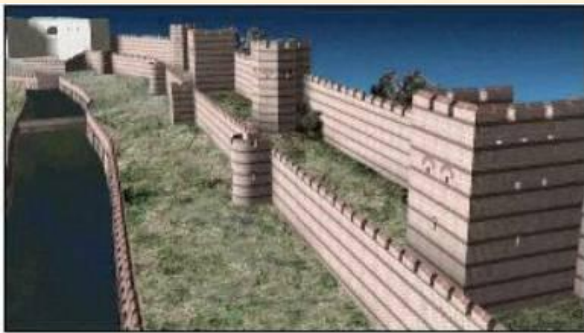
Стены Константинополя. Реконструкция.

По-видимому, русские применили технику волока: поставили ладьи на катки и подкатили их к стенам, поразив и напугав непривычных к такому зрелищу греков.