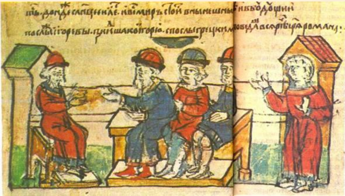
Заключение мирного договора. Миниатюра из Радзивилловской летописи.