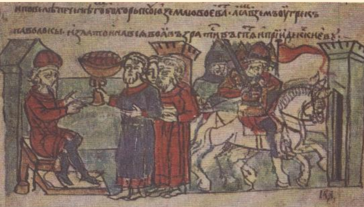
Византийские послы просят мира. Миниатюра из Радзивилловской летописи.

Император прислал к Игорю послов со словами: «Не ходи к граду, но возьми дань, юже имал Олег, придам и еще к той дани». Князь обратился к дружине за советом.