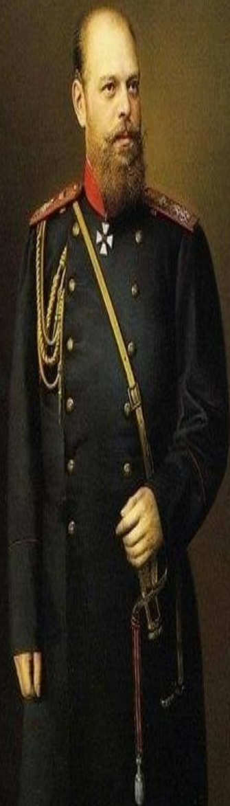
Александр III Миротворец 1845-1894 гг.

У России только два надёжных союзника - её армия и флот.