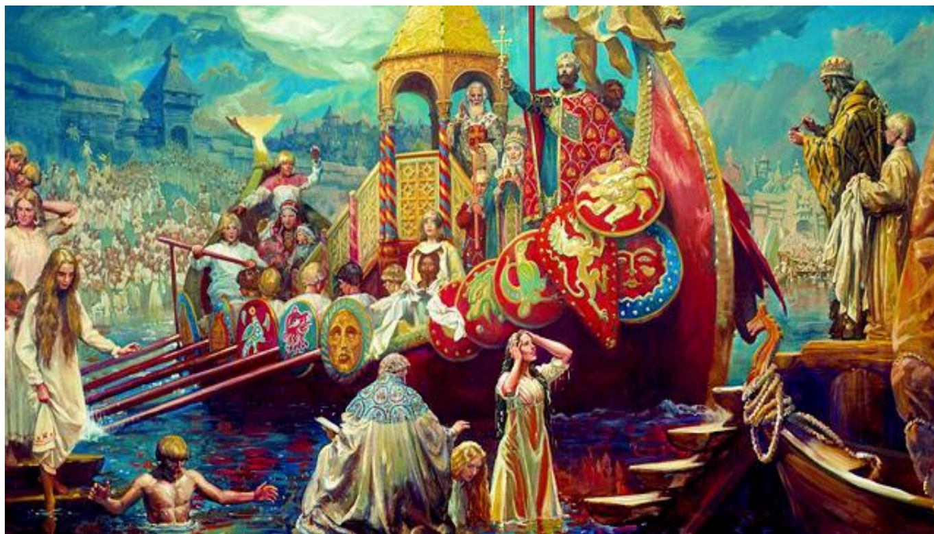
Фрагмент репродукции картины Михаила Шанькова "Крещение Руси"

Владимир объявил христианство государственной религией.