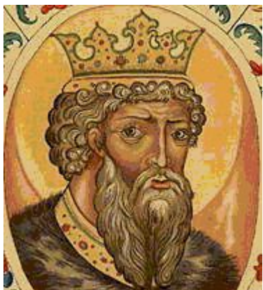
Великий князь Владимир Святославич. Рисунок из книги «Титулярник». 1672.