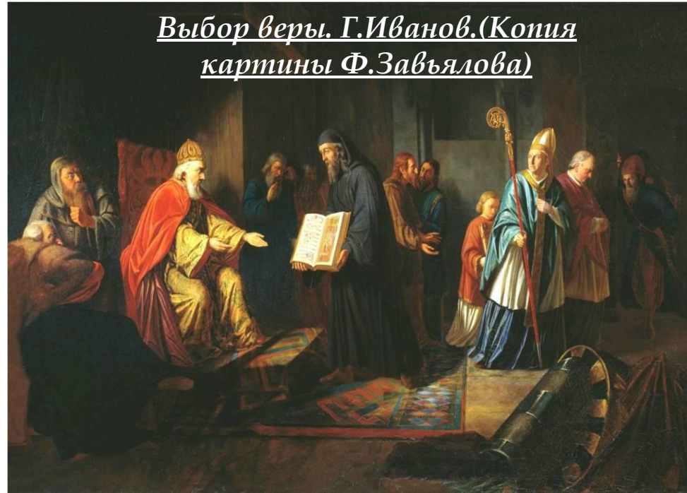
Выбор веры. Г.Иванов. (Копия картины Ф.Завьялова)

Посланников папы римского, который возглавляет исповедующих католицизм, Владимир выслушал и сказал: «Идите обратно; отцы наши не приняли веры от папы».