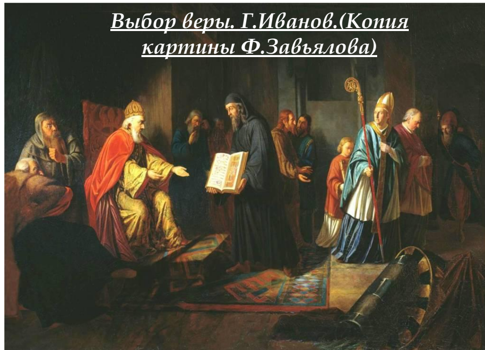
Выбор веры. Г.Иванов.(Копия картины Ф.Завьялова)

Посланников папы римского, который возглавляет исповедующих католицизм, Владимир выслушал и сказал: «Идите обратно; отцы наши не приняли веры от папы».