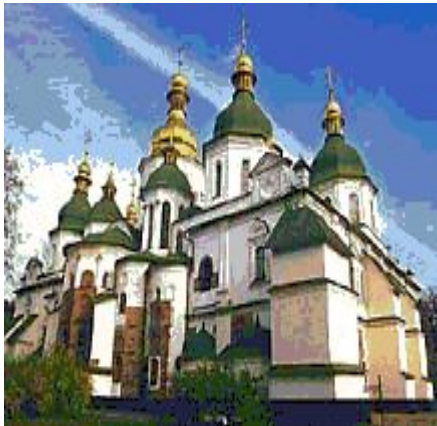
Киев. Софийский собор