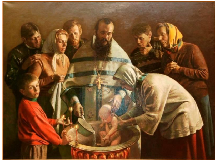
После крещения Руси.