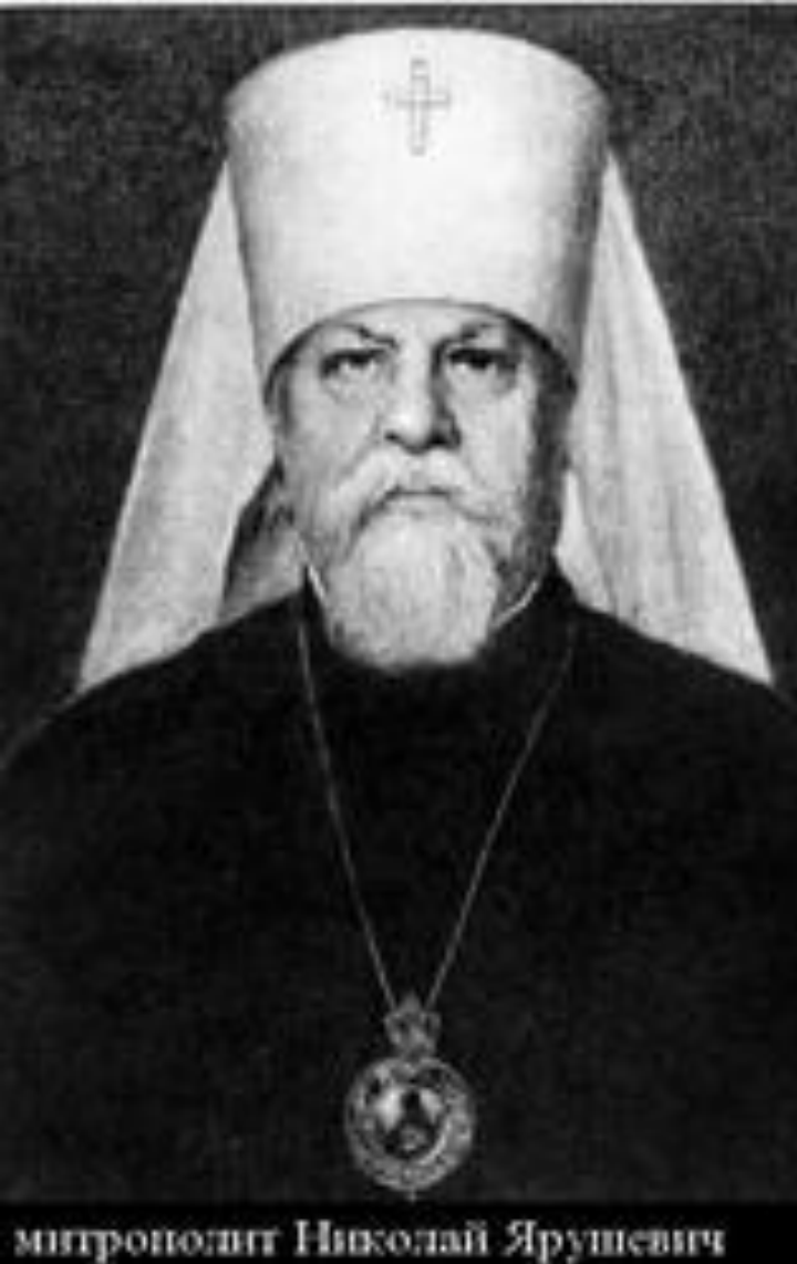
митрополит Николай Ярушевич