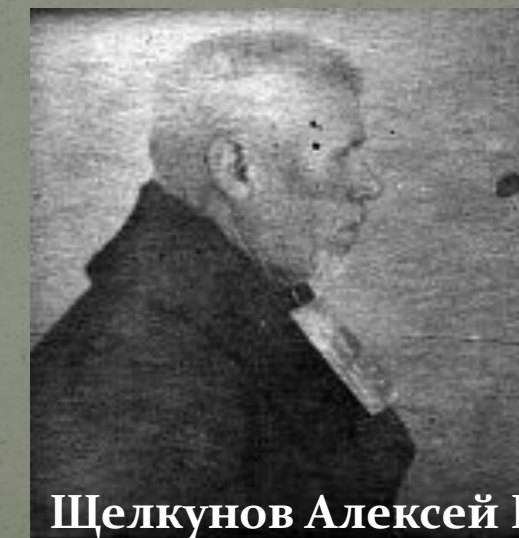
Фото в деле нет