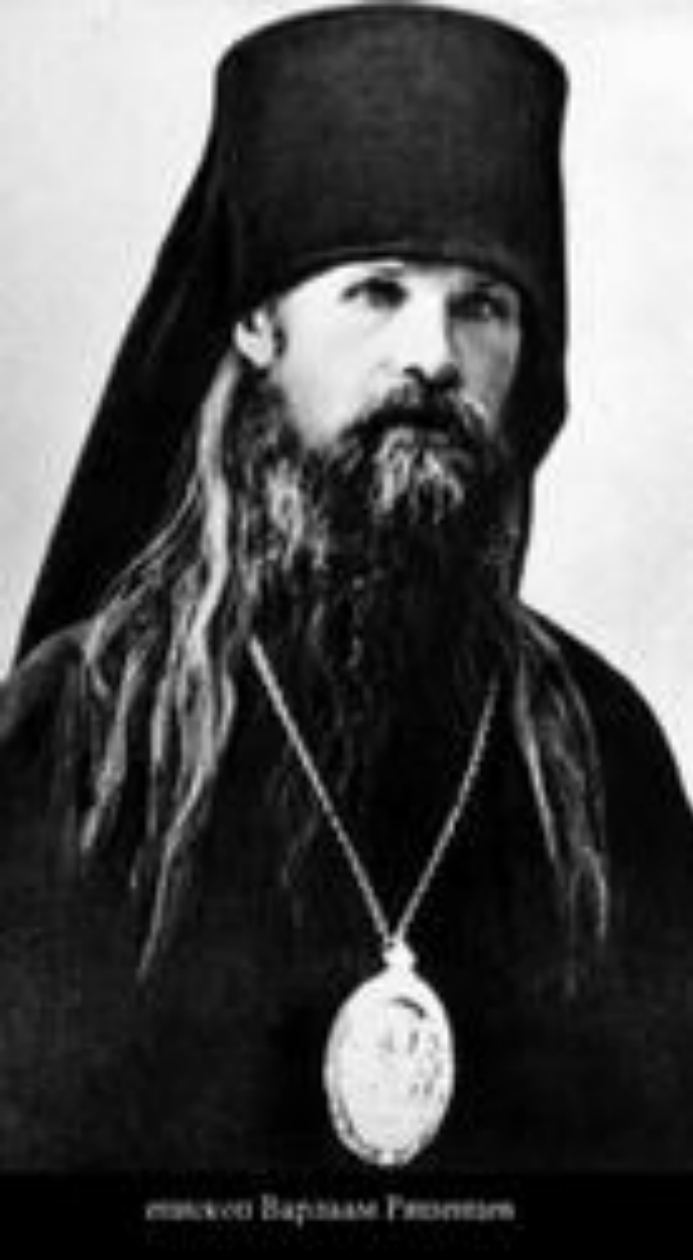
епископ Варлаам Ряшенцев