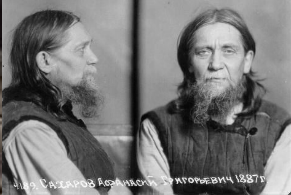
Епископ Афанасий (Сахаров)

Из книги «Жинеписание священномученика Серафима Звездинского»: «Прибыли в Котлас. Арестантов расконвоировали. Была Троицкая суббота (14 мая 1923 г), и духовенство решило пойти в церковь. Три епископа — Серафим (Звездинский), Афанасий (Сахаров) и Николай. (Ярушевич) — вошли в храм, но оказалось, что храм обновленческий. Ссылные архиереи вышли.