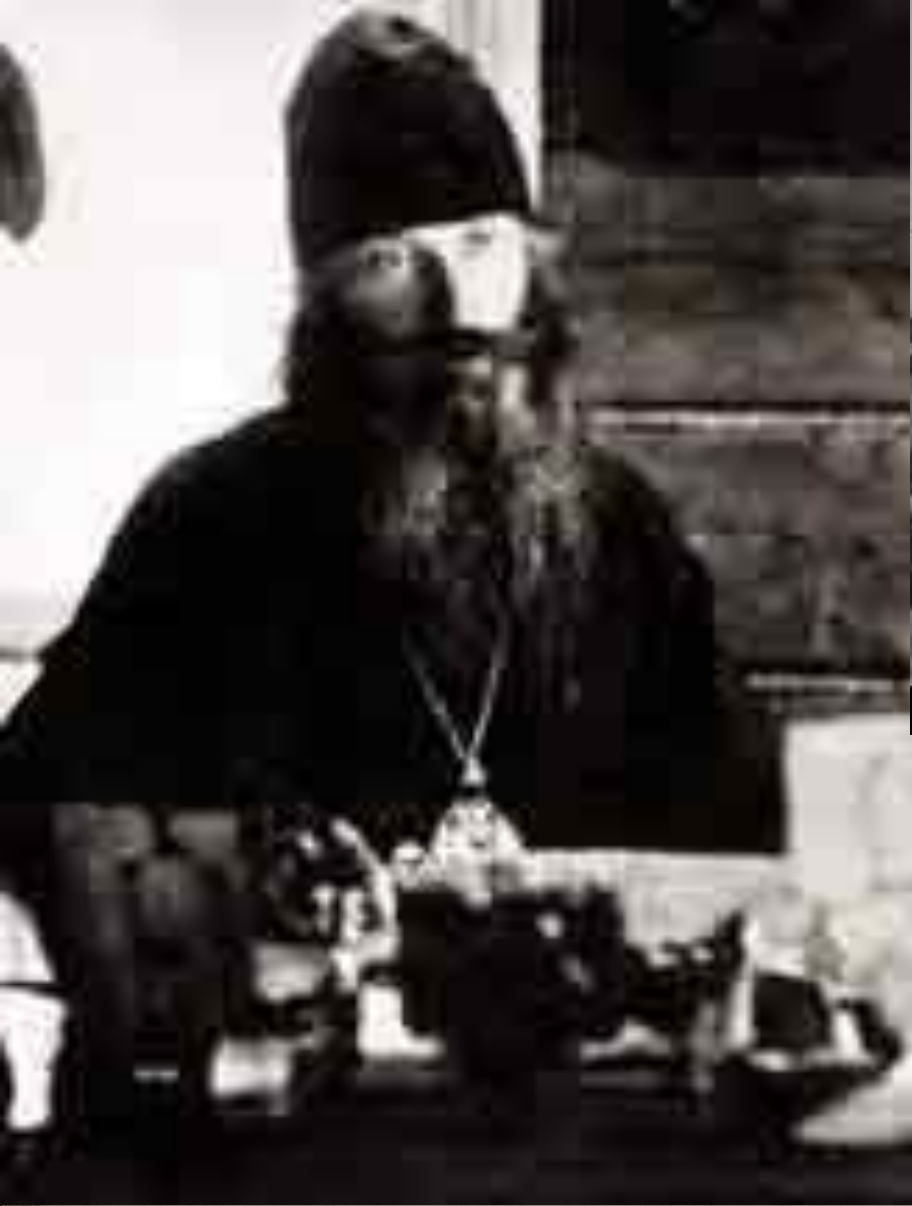
Епископ — Серафим (Звездинский)