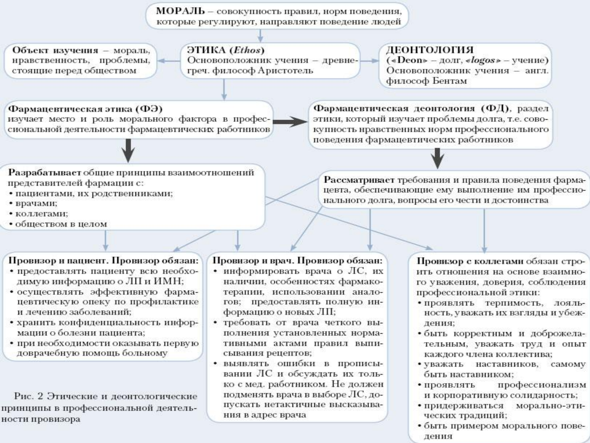
Рис. 2 Этические и деонтологические принципы в профессиональной деятельности провизора