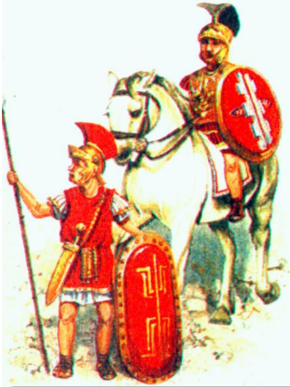
Отставные преторианцы в Сирии.

Октавиан сократил численность армии. Отставные воины были поселены в провинциях, а пособия им платили из сокровищ египетских царей.