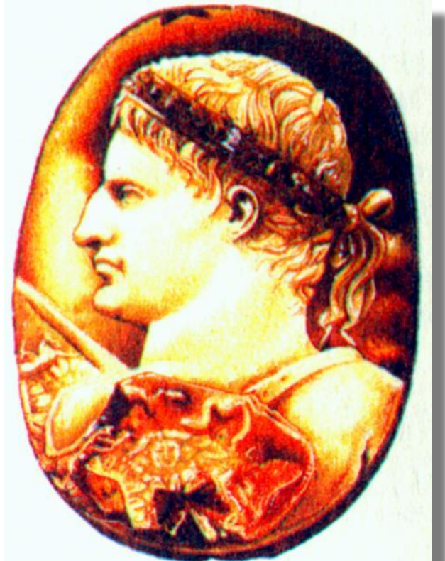
Октавиан. Древнеримская камя.

Октавиан, обвинял соперника в разбазаривании земель, которые тот дарил жене и дочерям.