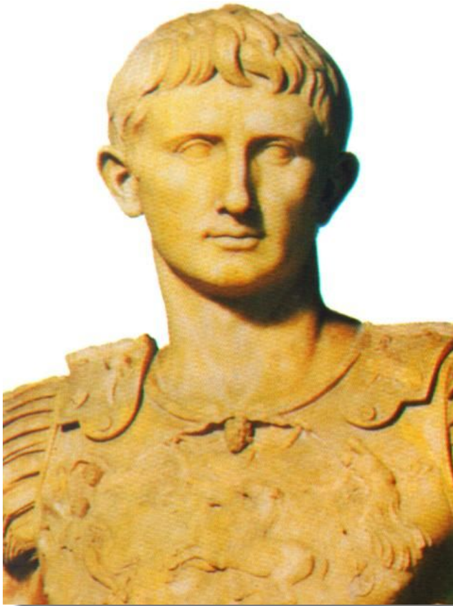
Октавиан Август- Император.

В 30 г до н.э. Октавиан объявил об окончании гражданских войн.