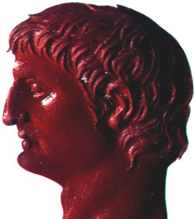
Марк Антоний. Древнеримский барельеф.

Убийство Цезаря в Риме восприняли неоднозначно.