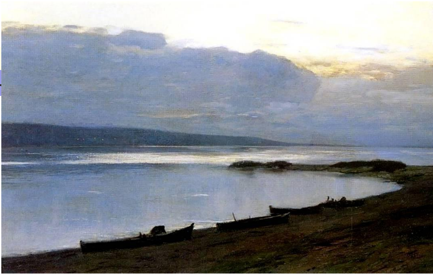
Вечер на волге. И.Левитан