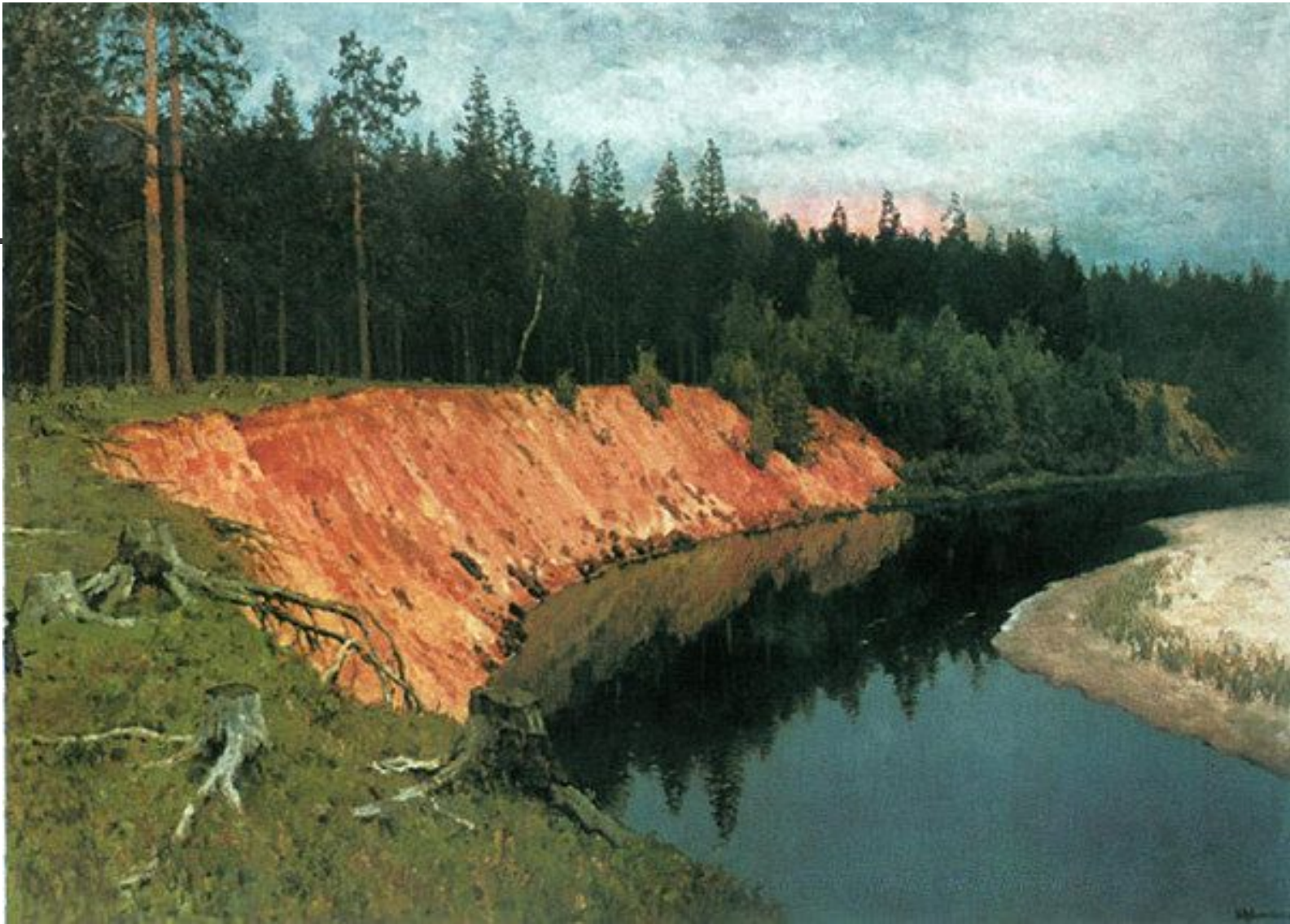
Лесистый берег И. Левитан