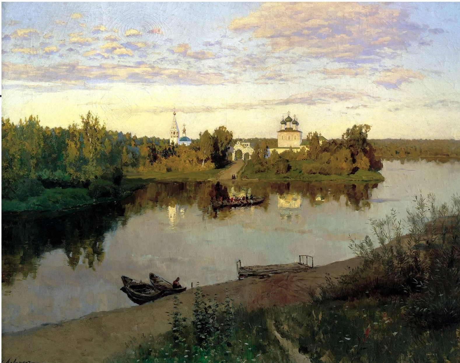
Вечерний звон. И.Левитан