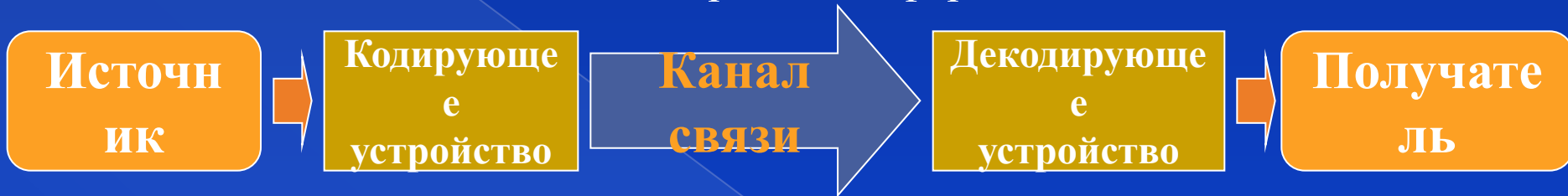
Схема передачи информации