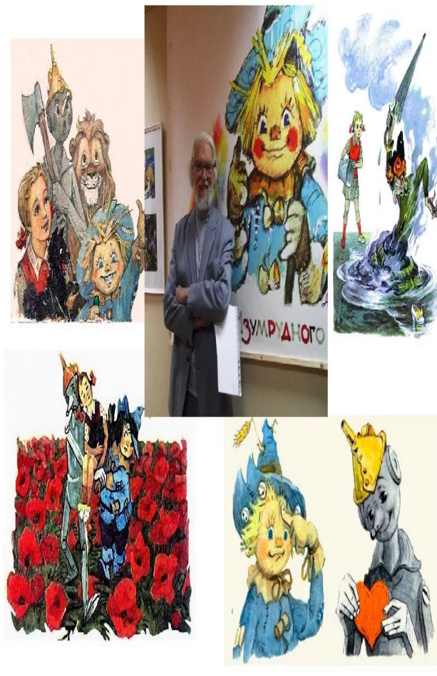
Леонид Викторович Владимирский, художник-иллюстратор

Леонид Викторович Владимирский всю свою жизнь рисовал акварелью. Больше всего он нарисовал сказок. Широко известной работой художника стали иллюстрации к шести сказочным повестям А. Волкова, первая из которых — «Волшебник Изумрудного города» — вышла в свет в 1959. Она впервые вышла отдельной книгой, еще до войны, с черно-белыми иллюстрациями художника Н. Э. Радлова. Новую волну интереса советской детворы к приключениям Элли вызвал выход в свет «Волшебника Изумрудного города» с новыми, оригинальными иллюстрациями Владимирского, цветными и красивыми.