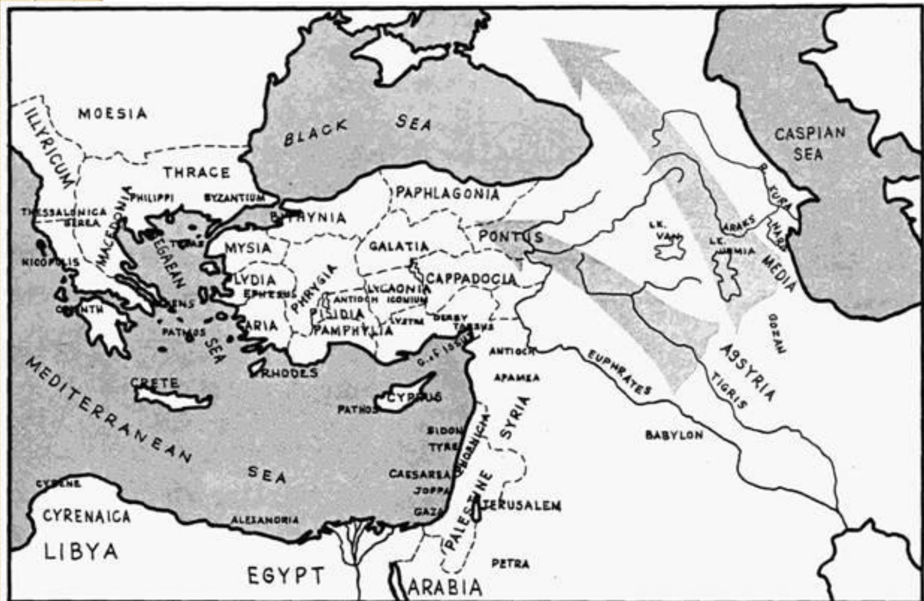
The Near East in New Testament times. This is the region to which Peter addressed his letters. Here Andrew labored.