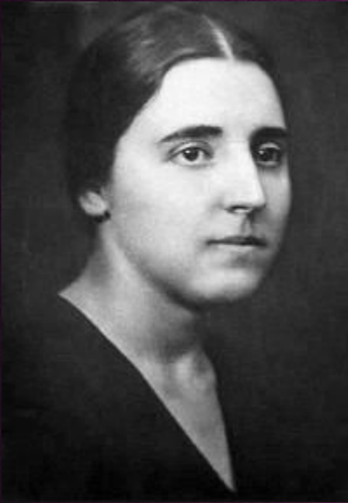
Надежда Аллилуева — вторая жена Сталина