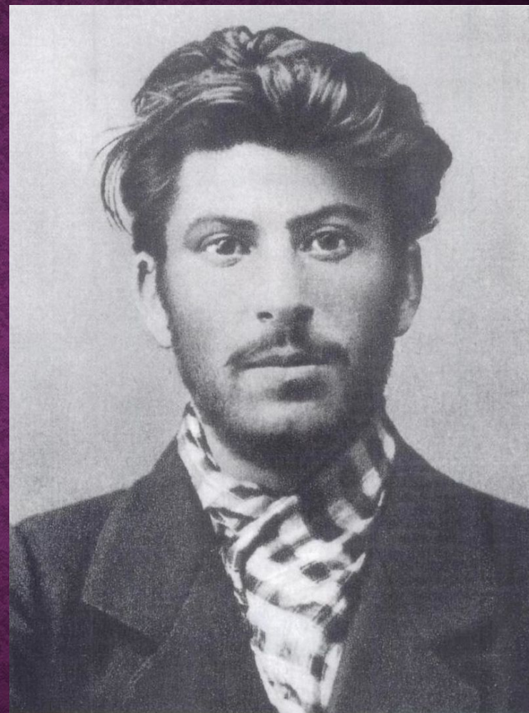
Член марксистского кружка ( 1902 )