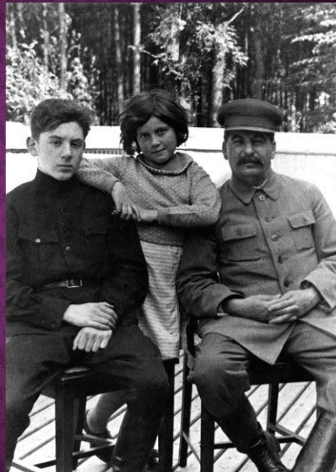
Светла́на Йо́сифовна Аллилу́ева