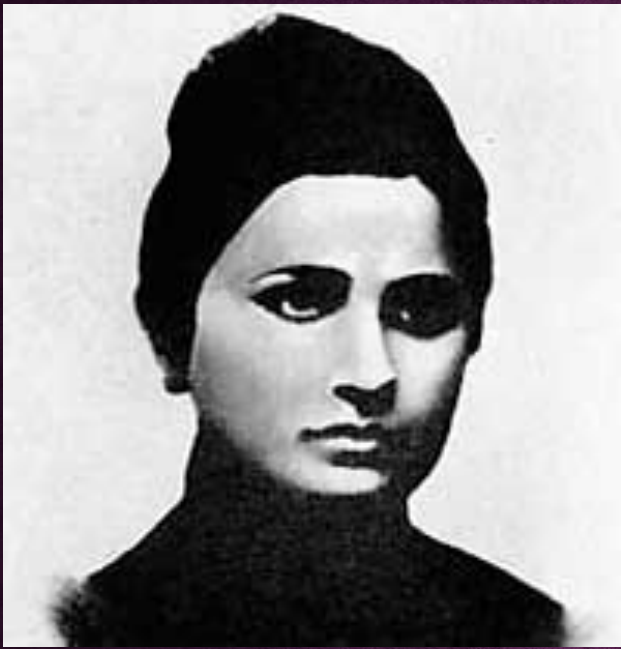
Екатерина Сванидзе — первая жена Сталина

Дочь грузинского дворянина. Жила в Тбилиси. Работала подёнщицей : прачкой и портнихой. Её брат учился вместе с Иосифом Джугашвили в Тифлисской духовной семинарии . Венчание состоялось в 1906 году в тифлисском храме. Умерла от туберкулёза (по другим источникам — причиной смерти был брюшной тиф ), оставив восьмимесячного сына. Похоронена в Тбилиси на Кукийском кладбище. Британский историк Саймон Монтефиоре , не сомневается в подлинности и силе чувств Сталина к Като: ссылаясь на свидетельства её родственников (которые практически все погибли в 30-е годы), отмечает, что во время похорон жены у Сталина помутился разум, и когда гроб с Като опускали в могилу, Сталин прыгнул туда и его с трудом извлекли обратно. Первенца Сталина Якова Джугашвили вырастила мать Като.