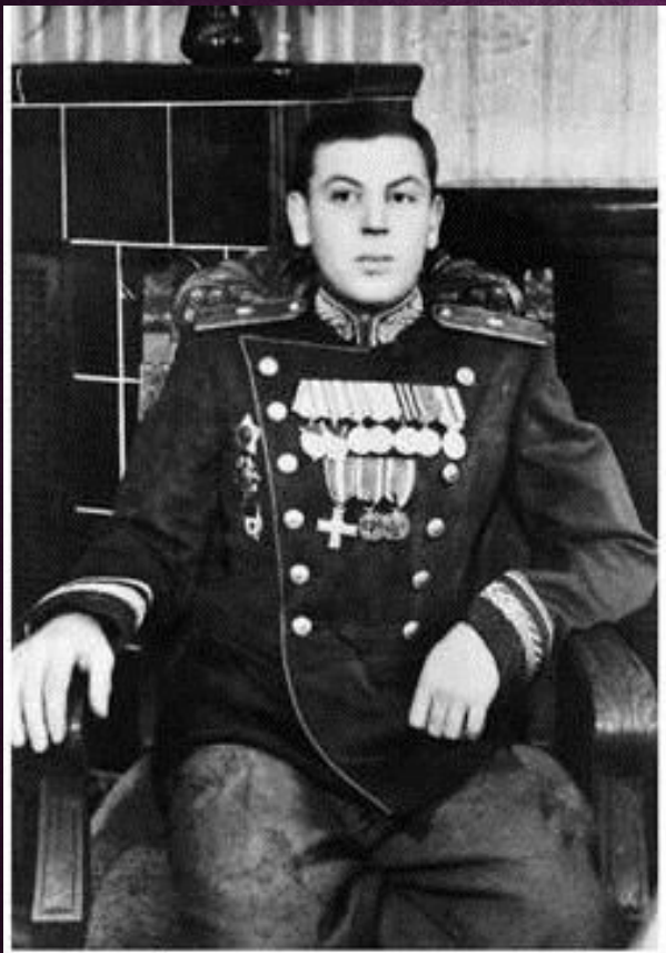
Васі́лий Йо́сифович Ста́лин