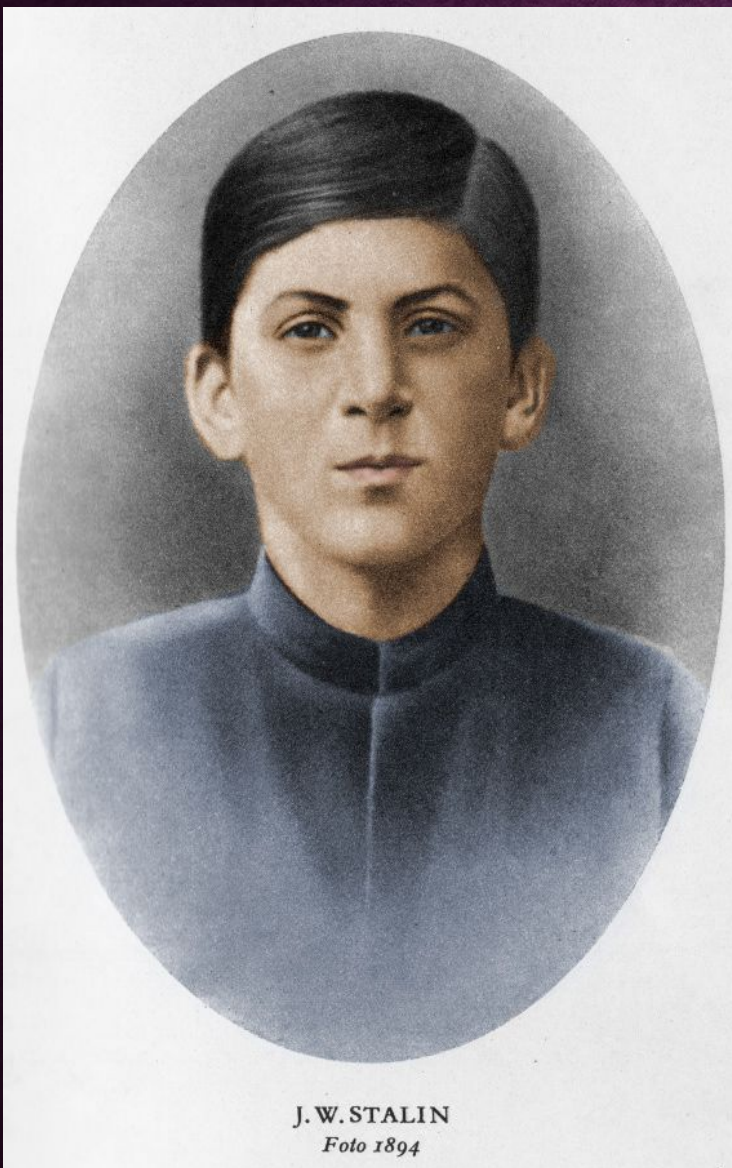
Сосó Джугашвили — ученик Тифлисской духовной семинарии ( 1894 )