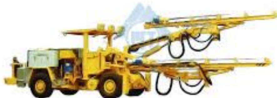
Рис.2. Установка бурильная шахтная УБШ 501АК на пневмоколесном ходу для бурения шпуров