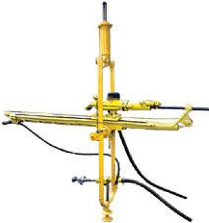
Рис.1 Установка переносная бурильная упб 1б