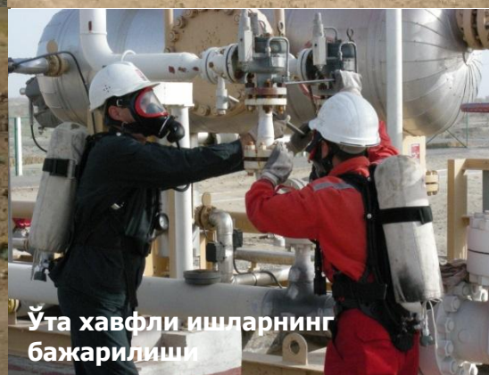
Ўта хавfli ишларнинг бажарилиши