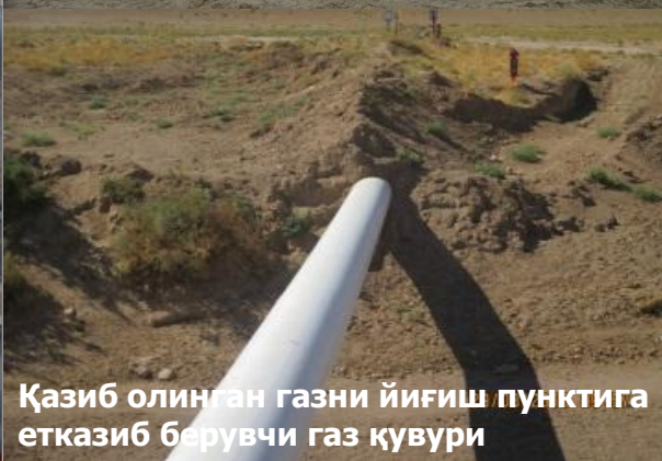
Қазиб олинган газни йиғиш пунктига етказиб берувчи газ қувури