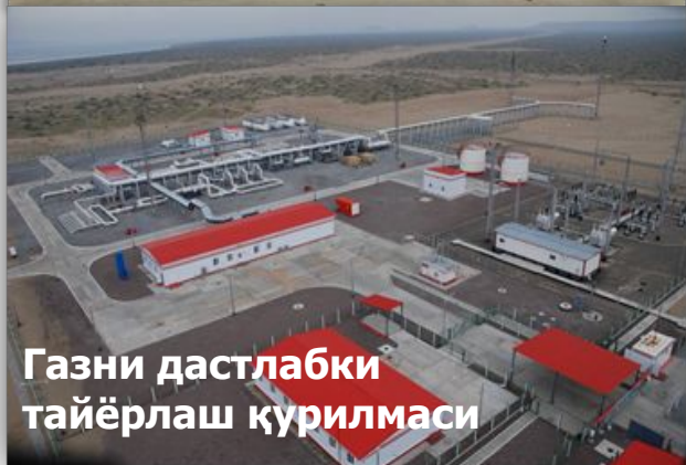
Газни дастлабки тайёрлаш қурилмаси