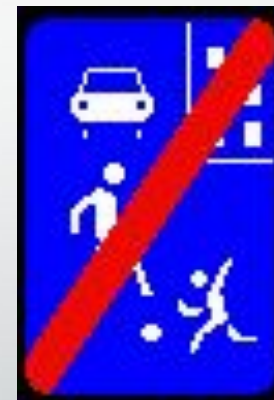
5.22 "Конец жилой зоны".