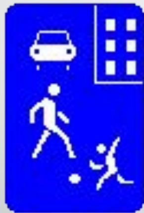
• 5.21 "Жилая зона"

17.1. В жилой зоне, то есть на территории, въезды на которую и выезды с которой обозначены знаками 5.21 и 5.22 , движение пешеходов разрешается как по тротуарам, так и по проезжей части. В жилой зоне пешеходы имеют преимущество, однако они не должны создавать необоснованные помехи для движения транспортных средств.