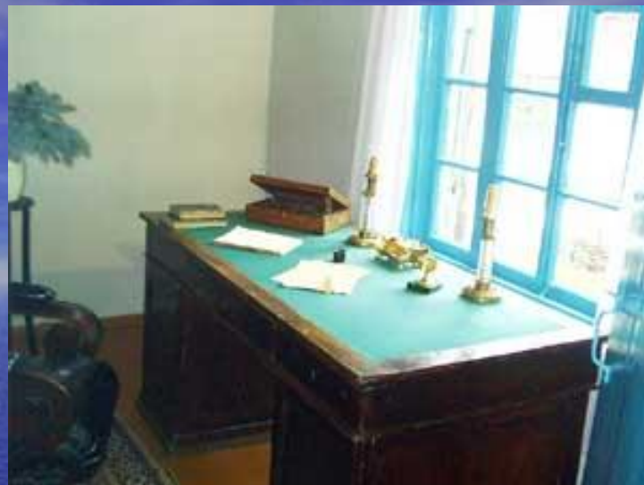
Стол и кресло Лермонтова