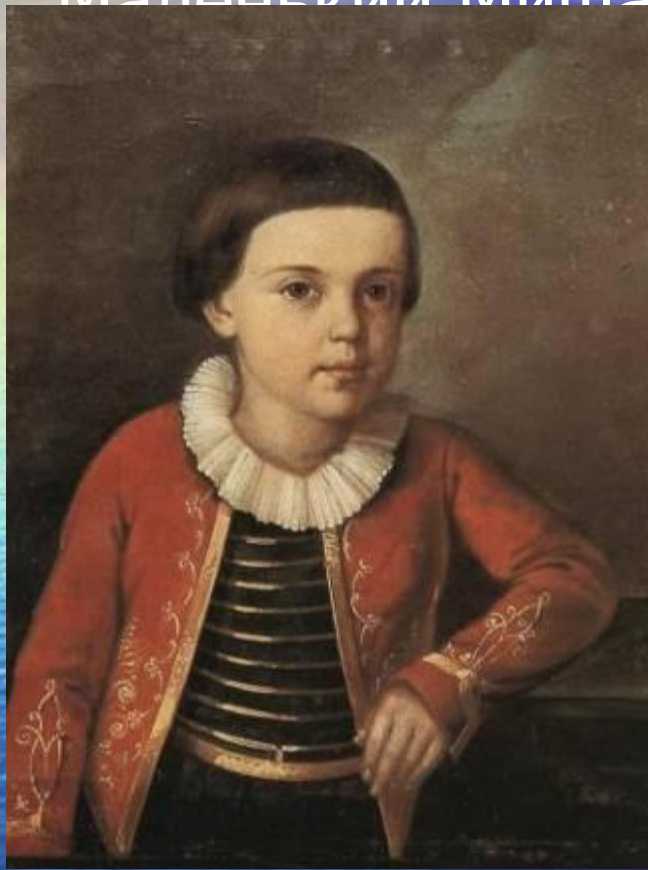
М. Ю. Лермонтов в детстве.