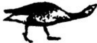
угроза на расстоянии