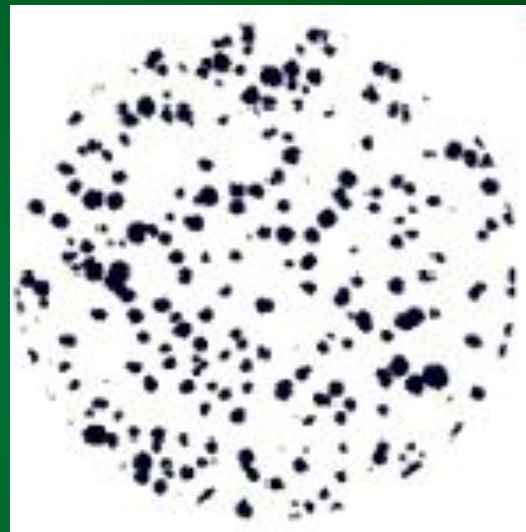
Высокопрочный чугун с шаровидным графитом