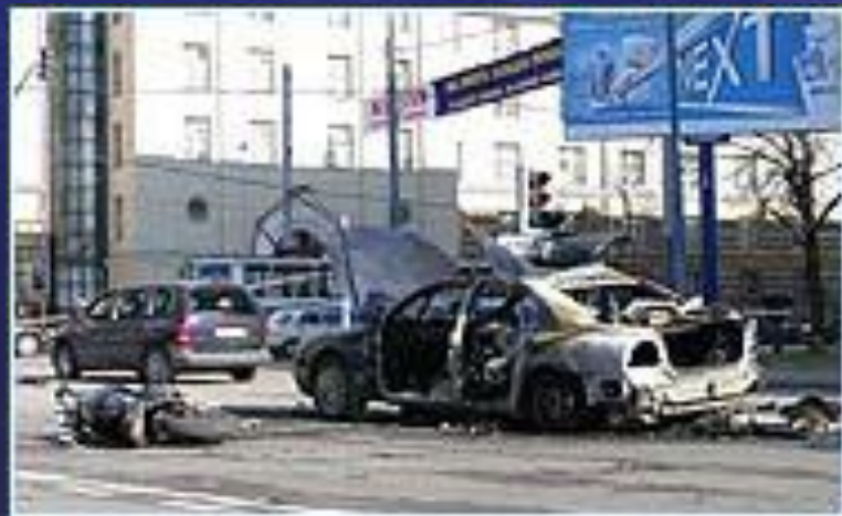
Подрыв автомобиля в Москве