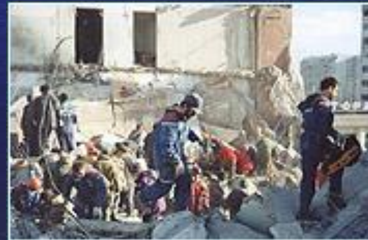
Взрыв дома в Каспийске