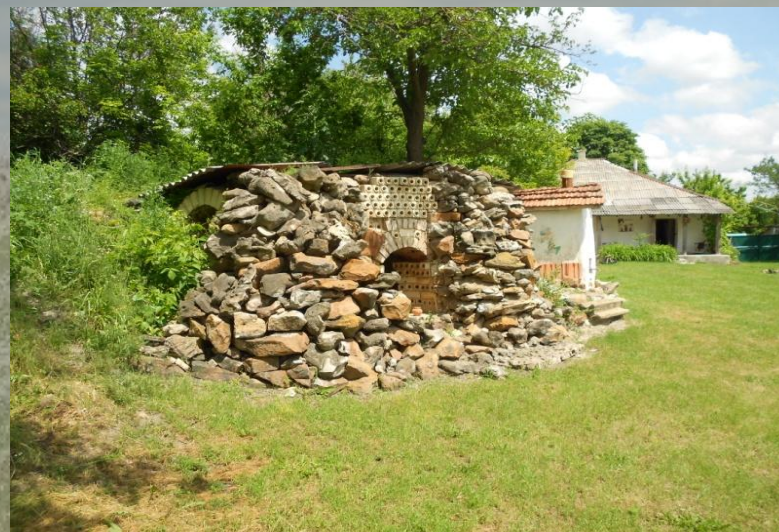
Печь для обжига глины