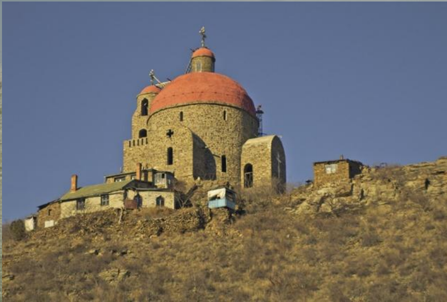
Сегодняшний вид Храма

Широкая душа создателя храма желала привести всех людей к Истине без насилия, ведь пути Господни неисповедимы