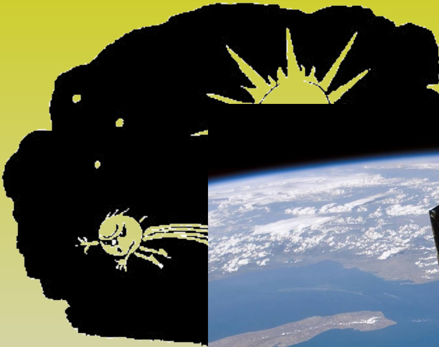
Отклонение хвостов комет