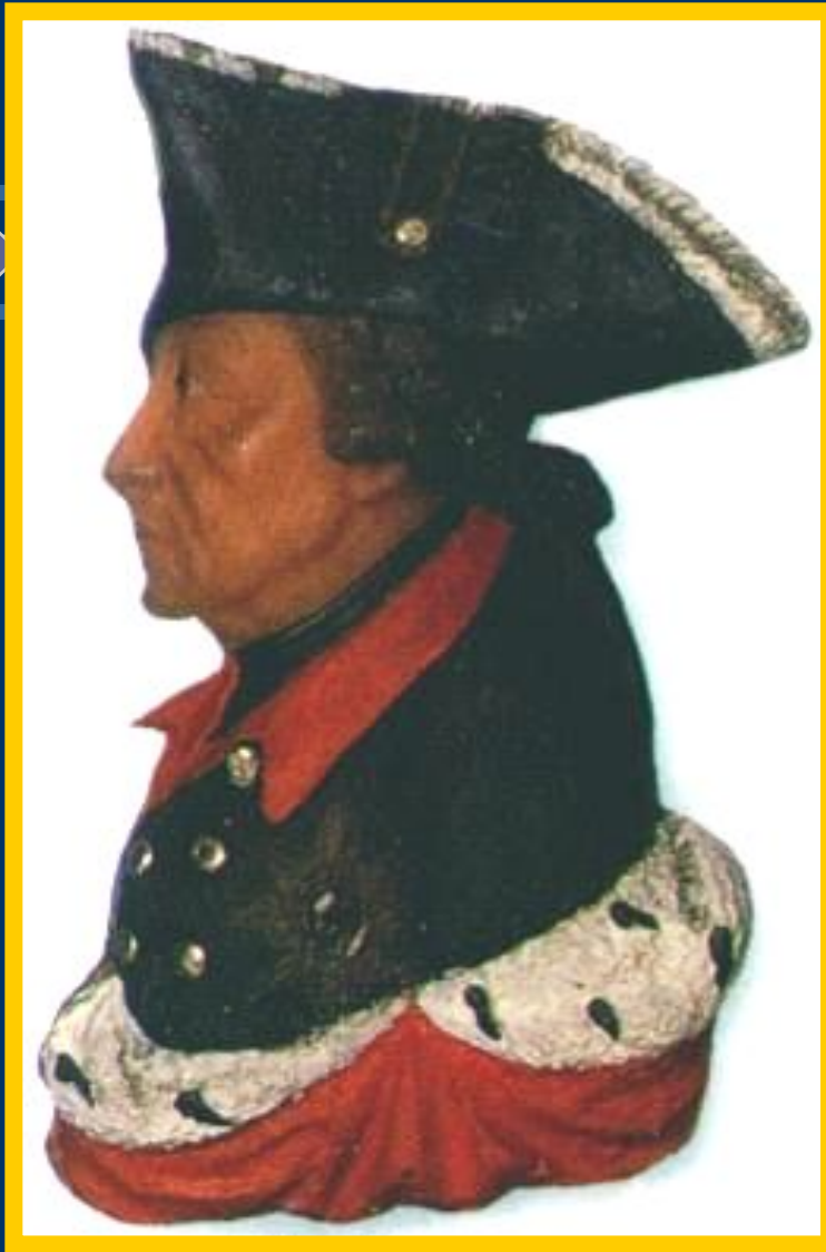
Фридрих II— Король Пруссии.

Международные отношения в 18 в. Были очень запутанны и противоречивы. Пруссия, возглавляемая Фридрихом II Великим на чала захватнические войны. В ходе борьбы за австрийское наследство Фридрих захватил Силезию и стремился подчинить Саксонию, Чехию, часть Польши. Он полагал что ослабшая Франция не станет мешать.