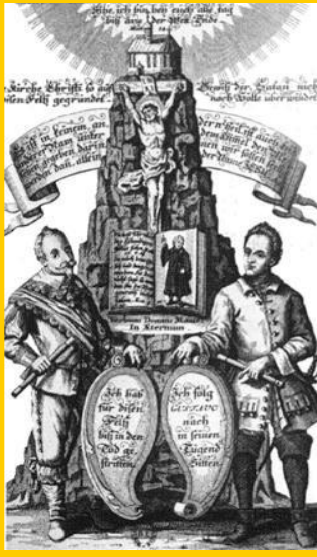
Густав Адольф II и Карл XII. Мощь Швеции.

Поражение в войне означало окончание французской гегемонии в Европе.