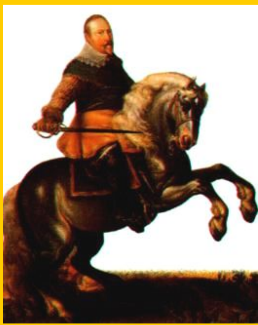
Шведский король Густав Адольф II.

В ответ вспыхнуло восстание. Королем был провозглашен Фридрих Пфальцский-ставленник Протестантской лиги.