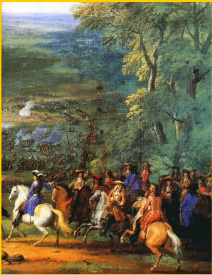
Принц Конде в битве при Рокруа.

Вскоре в Германию вторглись шведы и в 1632 г. Густав Адольф II разбил католиков, но сам погиб. В 1634 г. Валленштейн был убит заговорщиками. Вскоре в войну вмешалась Франция. Ришелье оказал немецким князьям финансовую помощь. В 1642-46 гг. союзники одержали ряд побед над австрийцами и испанцами и 24 октября 1648 г. в Мюнстере был подписан Вестфальский мир.