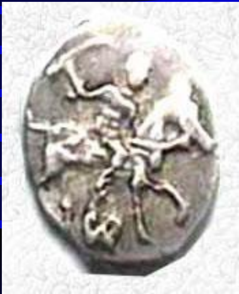
Копейка 1547 г.

В 1535-1538 гг. прежние монеты были запрещены, вводились новый, единый рубль и копейка.