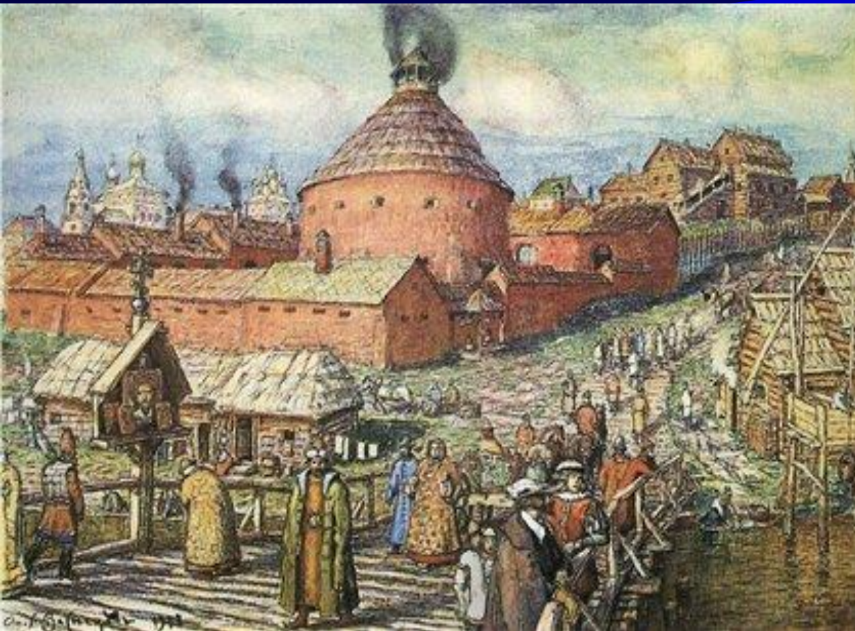
А. Васнецов. Пушечно-литейный двор на реке Неглинка.

В XVI в. круг ремесленных специальностей расширился. Наиболее рас- пространенными ремеслами были - производство оружия и домаш- ней, церковной утвари. Изделия ремесленников с успехом продава- лись и за грани- цей.