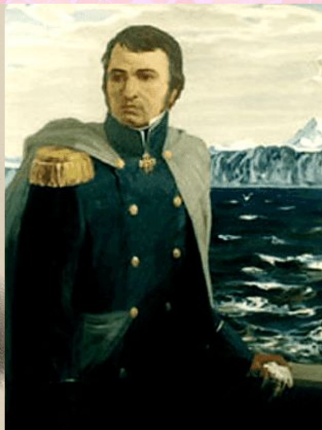
И. Ф. Крузенштерн