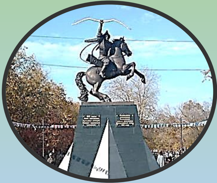
Памятник башкирским полкам. войны.