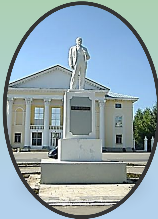
Памятник В.И. Ленину.