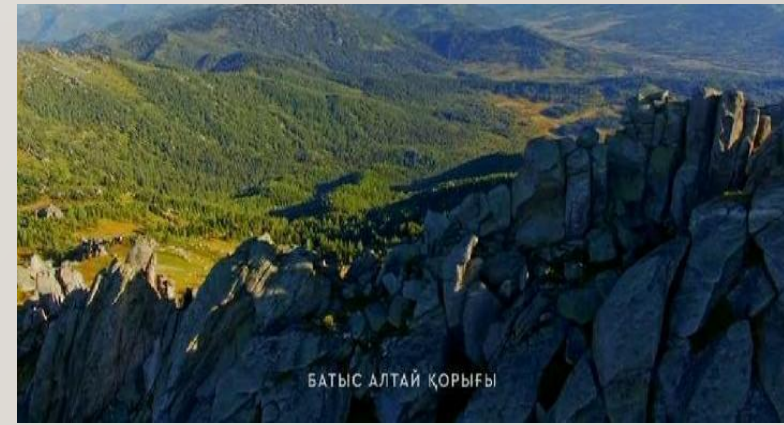
БАТЫС АЛТАЙ ҚОРЫҒЫ

Батыс Алтай мемлекеттік табиғи қорығы Кенді Алтайдың солтүстік-батыс бөлігінде Шығыс Қазақстан облысының Риддер (Лениногор), Зырян, Глубокое (Орталық кеңсе-үй-жайы Глубокое ауданының Риддер қаласында орналасқан) аудандарының аумағында Поперечное ауылының оңтүстік-шығысында табиғатты пайдаланудан алынып қойылған жерлерде орналасқан. Батыс Алтай қорығының аудандастырылуы Оңтүстік-Сібір тау елдерінің Алтай провинциясына жатады. Қорықтың ландшафтық кешеніне Иванов (2800 м), Холзун (2500 м), Көксін (2300 м), Тигирецк (2300 м), Линейск (1600 м), Уба (2067 м), Үлбі (2000 м) жоталарының