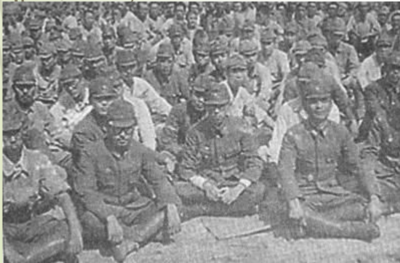
Японские военнопленные. 1945г.

С 19 августа японские войска почти повсеместно начали капитулировать. В плену оказалось 148 японских генералов, 594 тыс. офицеров и солдат. К концу августа было полностью закончено разоружение Квантунской армии и других сил противника, располагавшихся в Маньчжурии и Северной Корее. Успешно завершались операции по освобождению Южного Сахалина и Курильских островов. Военная кампания Вооруженных Сил СССР на Дальнем Востоке увенчалась блестящей победой. Ее итоги трудно переоценить. Официально кампания длилась 24 дня. Были наголову разбиты ударные силы врага. Японские милитаристы лишились плацдармов для агрессии и основных своих баз снабжения сырьем и оружием в Китае, Корее и на Южном Сахалине.