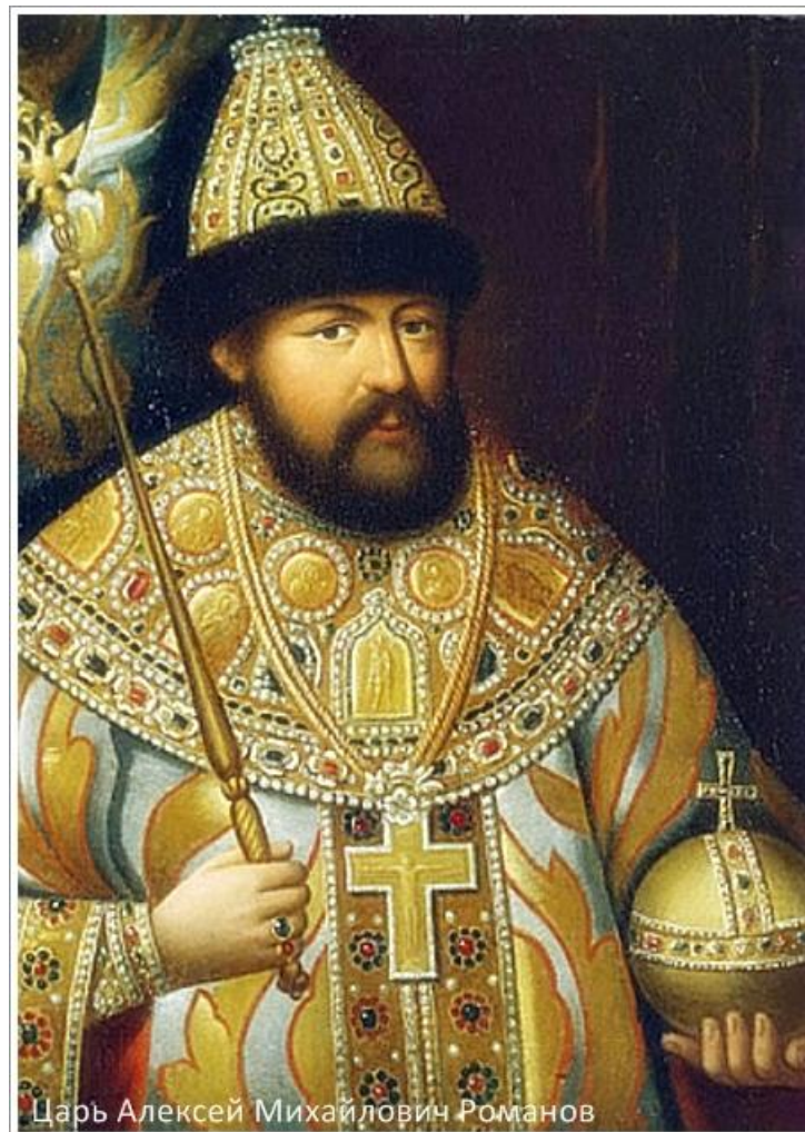
Царь Алексей Михайлович Романов