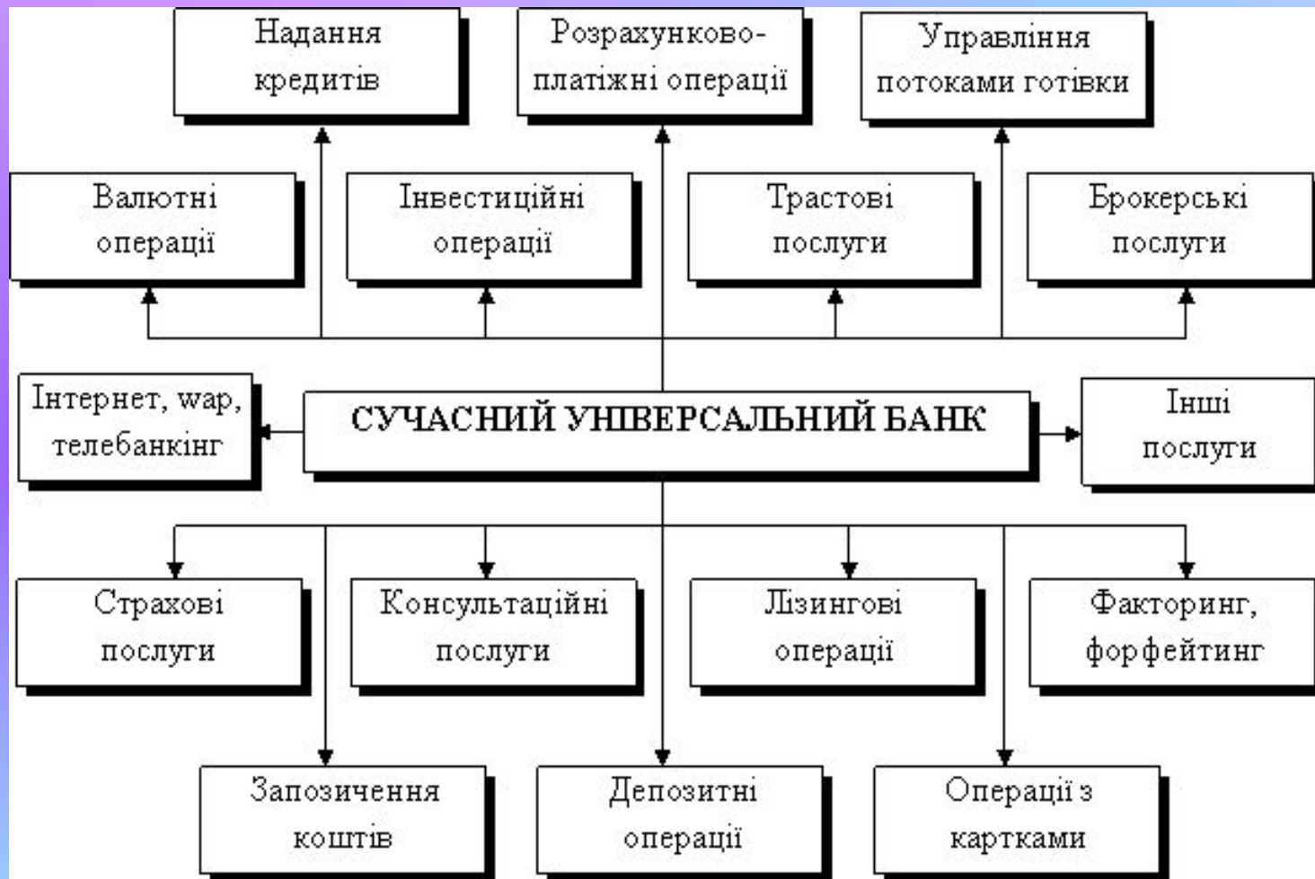
Рис. 14.4. Класифікація комісійних операцій комерційних банків