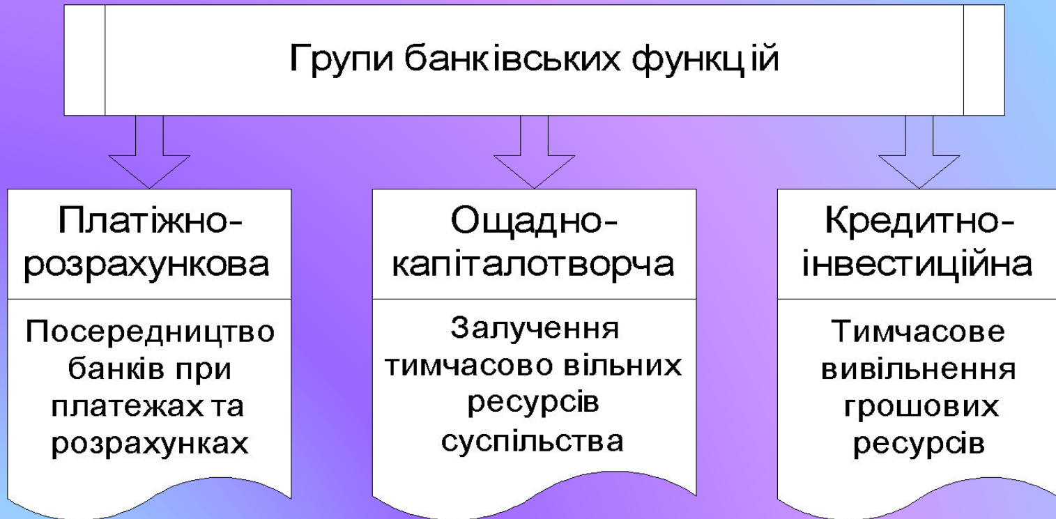
Рис. 14.1. Групи банківських послуг