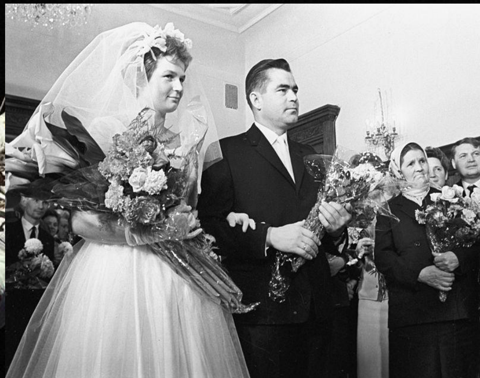
Торжественная церемония бракосочетания летчиков-космонавтов Валентины Терешковой и Андряна Николаева. Москва, 3 ноября 1963