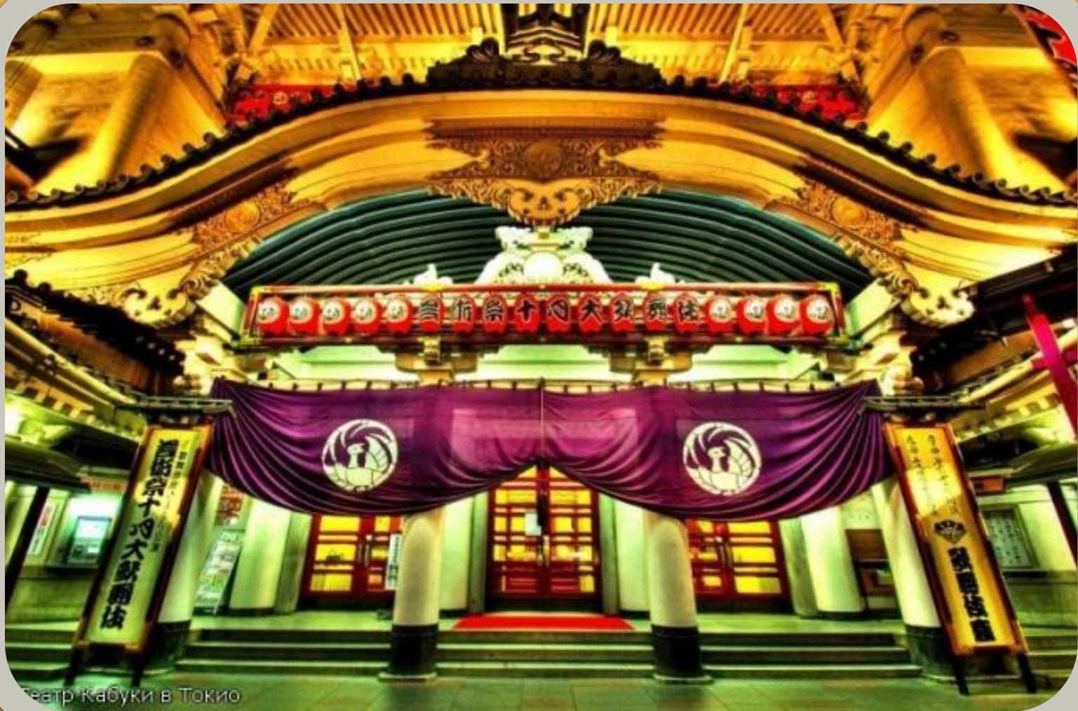
Театр Кабуки в Токио