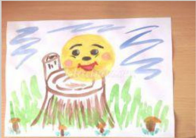
Рисунок и музыка