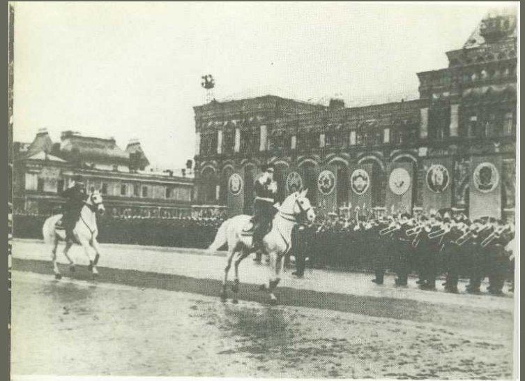
Парад Победы. Москва. 24 июня 1945 г.