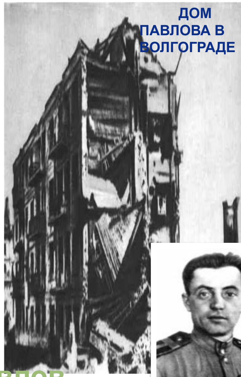
ДОМ ПАВЛОВА В ВОЛГОГРАДЕ