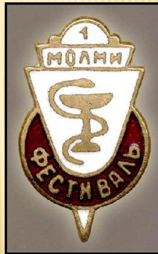
Фестивальный значок 1957 года

В годы Великой Отечественной Войны 1-й МОЛМИ дал стране 2632 врача. За выдающиеся заслуги в развитии медицинской науки и подготовки квалифицированных медицинских кадров в 1940 году институт был награждён орденом Ленина. Институт стал называться 1-м Московским Ордена Ленина медицинским институтом (1-й МОЛМИ). В 1955 году 1-му МОЛМИ присвоено имя И. М. Сеченова.