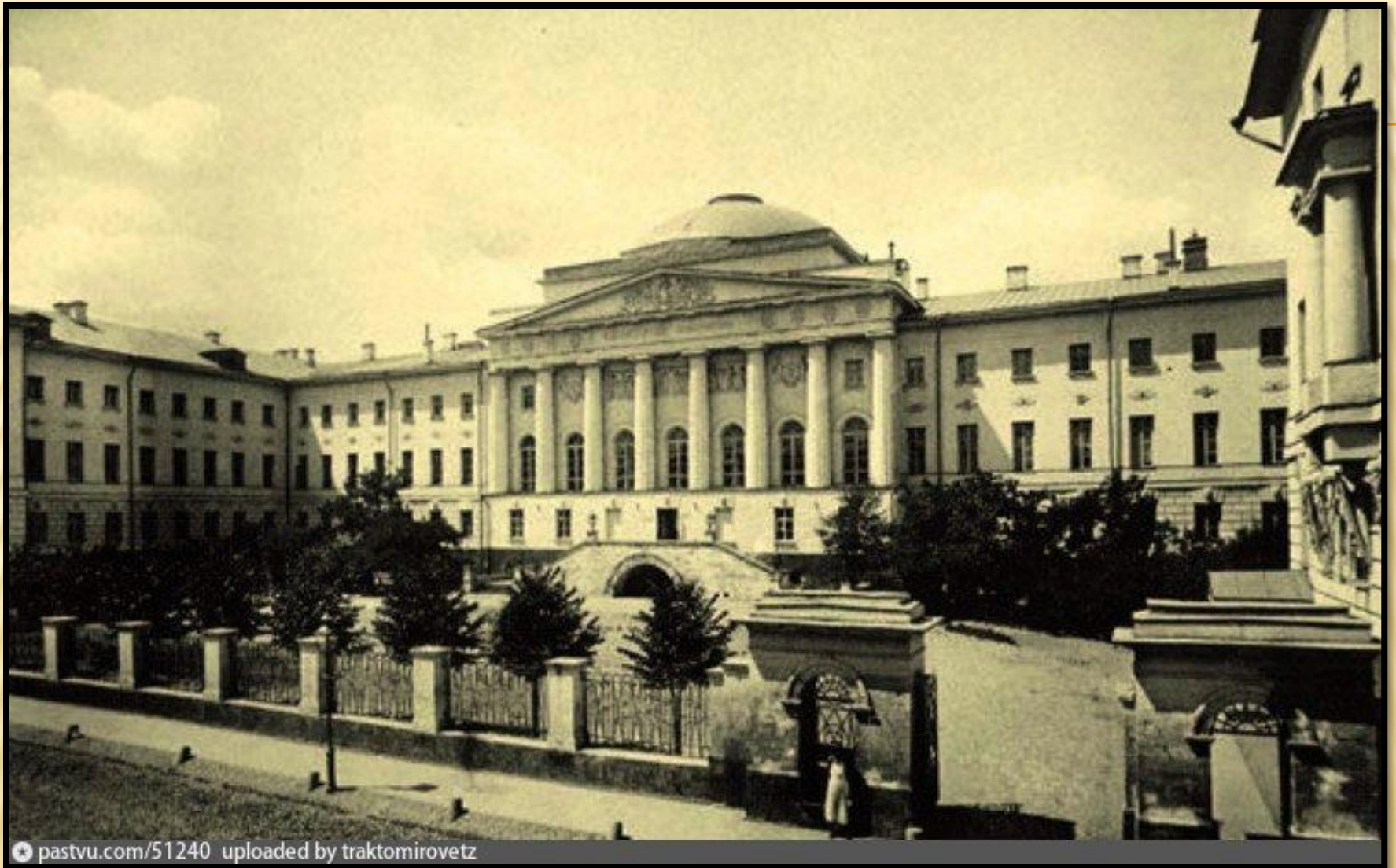
Императорский Московский Университет