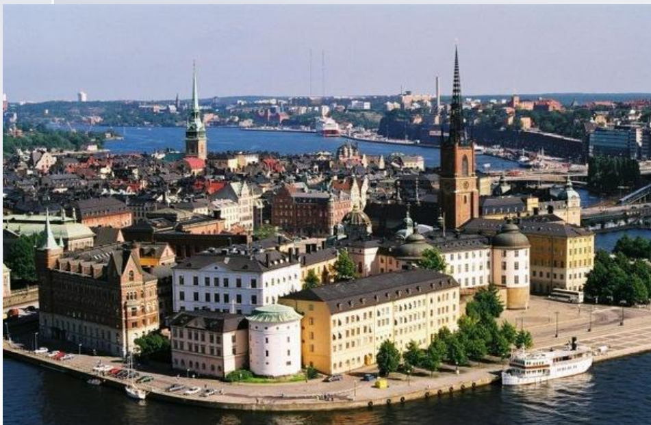
Столица - Стокгольм