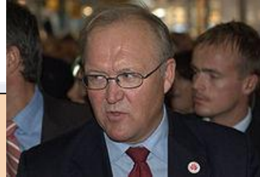
Ханс Йоран Перссон

Лидер Социал-демократической партии Швеции 1986 - 96 гг.